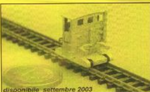
disponibile settembre 2003

Modello in kit LISTINO € 50,00 OFFERTA HME € 40,00