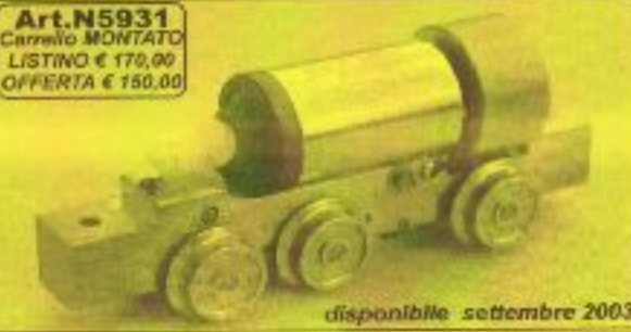
disponibile settembre 2003

Art.N5931 Carrello MONTATO LISTINO € 170,00 OFFERTA € 150,00