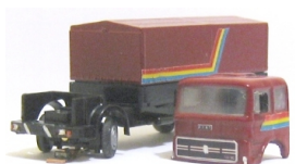
Fiat 619 FCS

Camion modello Fiat 307 adibito a camion per la nettezza urbana.