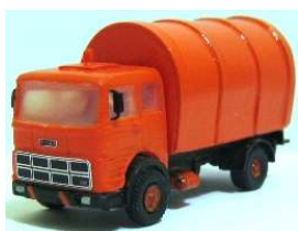
Fiat 307 nettezza urbana

Pulmann Fiat 307. Il modello è stato progettato perché il telaio originale possa essere sostituito agevolmente con il telaio del camion tedesco del Faller Car System.