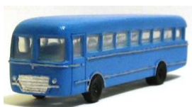
Pullman Fiat 307

Cabina dell'autocarro FIAT 619 studiata per rendere italiano il camion tedesco del sistema Faller Car System.