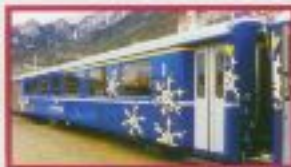
Einheitswagen EW II