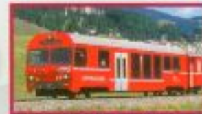
Steuerwagen NEVA Retica