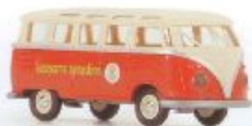
v 31808 VW T1 Samba "Husqvarna symaskiner" € 9,00