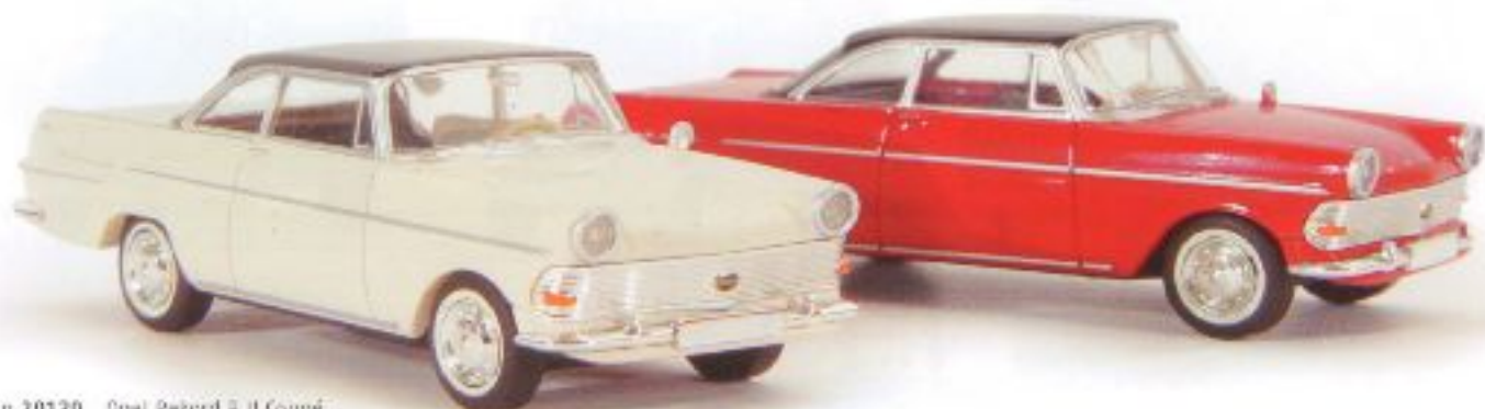
n 20120 Opel Rekord P II Coupé, sortiert TD € 10,00