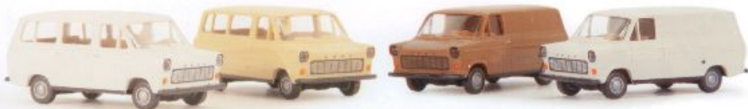
n 34200 Ford Transit II + Kombi (1975-79), sortiert € 8,50