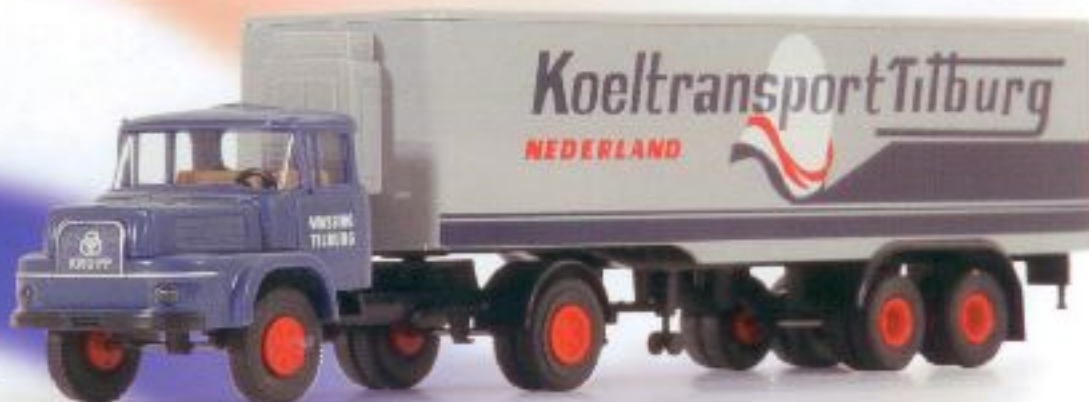
v 84008 Krupp Cummins S 960 Kühlsattelzug "Tilburg" € 16,00