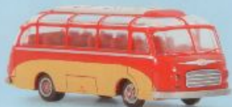
v 56003 Setra S 6 (1955-64) mit neuen Dekoren, sortiert. € 14,50