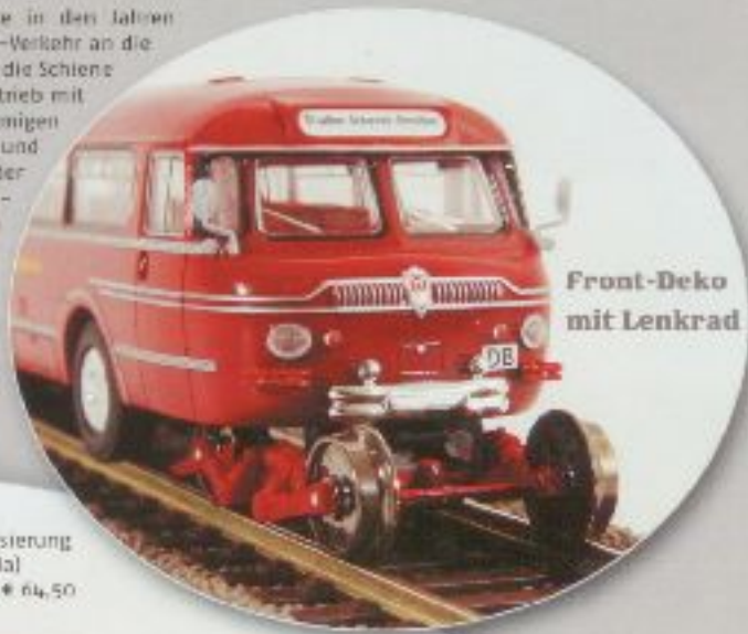
Front-Deko mit Lenkrad

Der Nordwestdeutsche Fahrzeugbau (NWF) lieferte in den Jahren 1953/54 den Bus-Typ BS 300 für den Schiene-Straße-Verkehr an die Deutsche Bundesbahn. Dahinter stand die Idee, wo die Schiene endet, auf der Straße weiterzufahren. Für den Betrieb mit Schienenlaufgestellen konnten die stromlinienförmigen Leichtbaufahrzeuge mittels Hydraulikstempeln vorn und hinten angehoben werden. So vielversprechend der Zweibegebetrieb anfänglich erschien, nur 15 der insgesamt 53 beschafften Busse kamen tatsächlich auch auf Schienen zum Einsatz. Die Mehrzahl der Wagen lief im normalen Straßenverkehr. Schon nach kurzer Betriebszeit wurden vier der insgesamt fünf Schiene-Straße-Verbindungen wieder eingestellt. Allein auf der Strecke Betzdorf-Koblenz konnte sich der Zweibegeverkehr mit den NWF-Bussen bis 1967 halten.