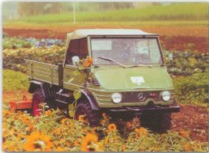
n 39070 Unimog 421 offen, 3 Farben sortiert € 9,50