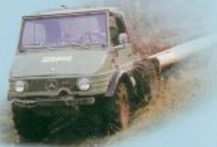
Der neue Unimog 421