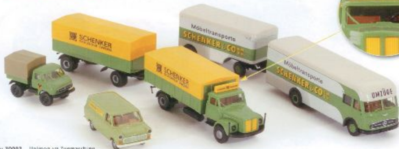
v 39003 Unimog 4x4 Zugmaschine "Schenker" € 10,00