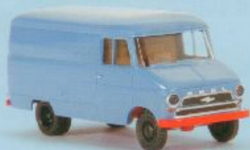
Der neue Opel Blitz '60 - '65