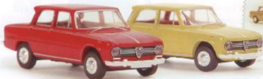
n 29550 Alfa Romeo Giulio 1300 TI Limousine 2 Farben, sortiert TD (4/2004) € 9,90