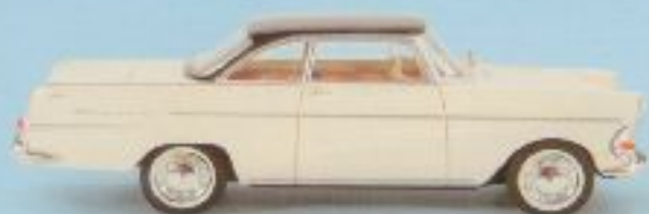
Das neue Opel Rekord P II Coupe