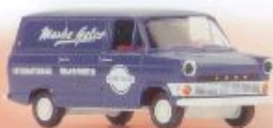
v 34056 Ford Transit IIa Kasten "Marbe Gelco" € 9,00