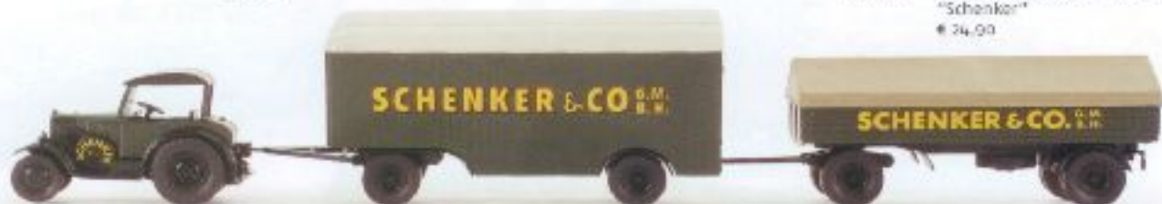
v 39341 Lenz Elbulldog mit 2 Anhängern "Schenker" € 24,00