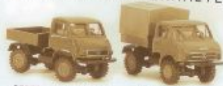
39050 Unimog 402 Pritsche, sortiert € 9,50 39009 Unimog 411 PP, sortiert € 10,00