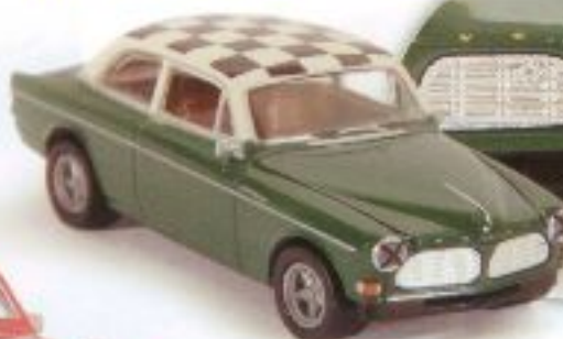
v 29203 Volvo Amazon 123, grün, Rallye TD € 9,90