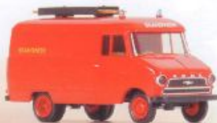
v 35602 Opel-Blitz Kasten '59 "BRANDVEER" € 10,00