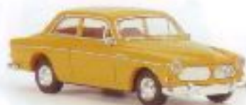
v 29202 Volvo Amazon Limousine, 2-türig, einfarbig, sortiert TD, neue Farben € 9,00