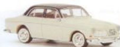
v 29245 Volvo Amazon Limousine, 4-türig, 2-farbig, neues Dekor, sortiert TD € 9,90