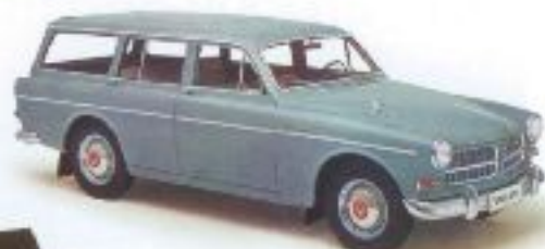
n 29250 Volvo Amazon Kombi, sortiert TD (10/2004) € 9,90