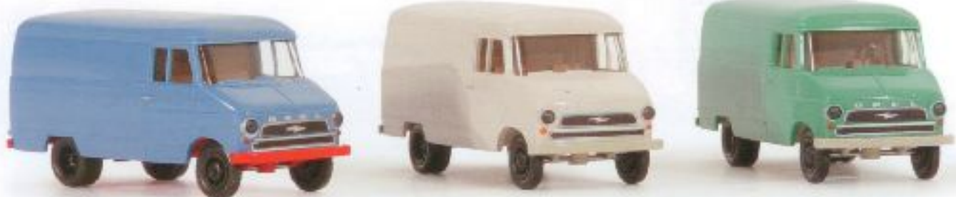
n 35600 Opel Blitz Kastenwagen A (1960-65), 3 Farben, sortiert € 9,00