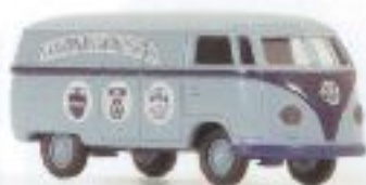
v 32016 VW T1 Kasten "Skandinavisk" € 9,00