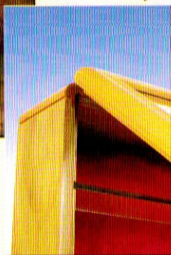
particolare della battuta antipolvere

... Costruiamo inoltre: basette, casse per trasporto modelli e articoli per modellisti.