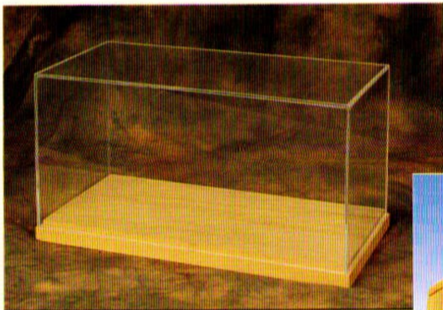
bacheca su misura

... Costruiamo inoltre: basette, casse per trasporto modelli e articoli per modellisti.