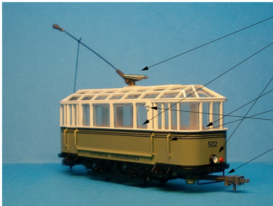
Abbildung zeigt Handmuster