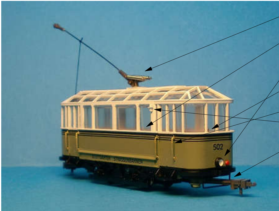
Abbildung zeigt Handmuster