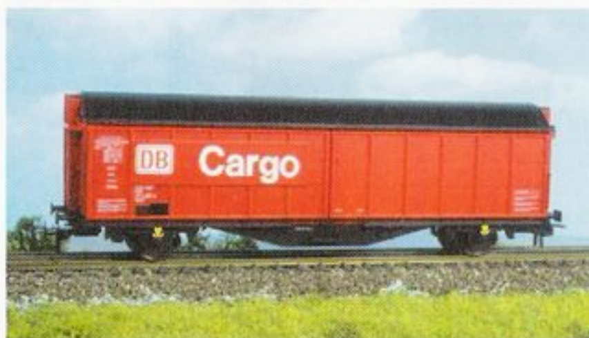
3159 DB, Ep. V, Schiebewandwagen