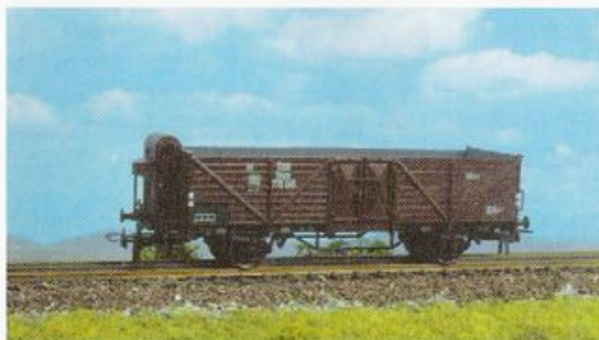
5028 ÖBB, Ep. III, off. Güterwagen m. Bremserhaus