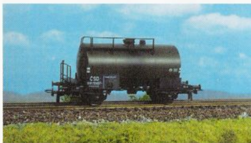
5029 CSD, Ep. III, Kesselwagen