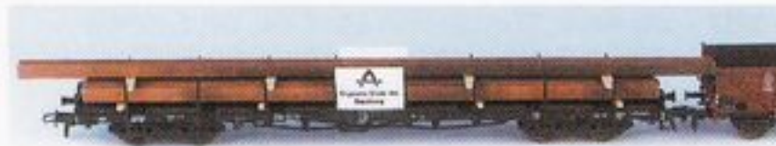
087/2 DB, Ep. III, 1 Res 680 beladen mit 4 H-Profilen und einem überlangen H-Profil ca. 320mm lang, 1 Omm37 Schutzwagen mit einer aufgehängten Stirnwandklappe.