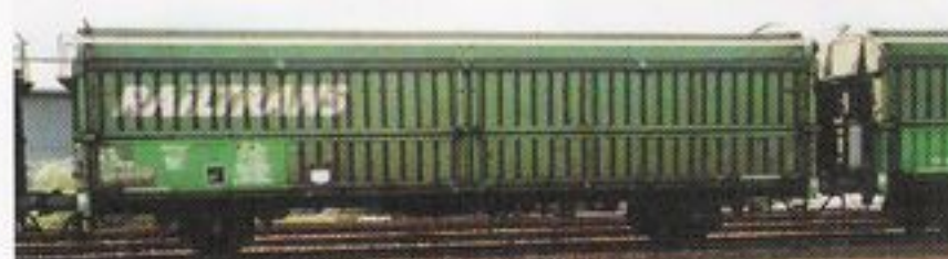
neue Formen T3206 23RIV87SNCF6852024-5 T3207 23RIV88 B 6855050-6