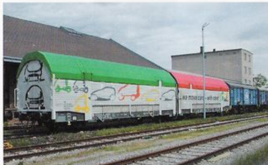
T33xx Autotransportwagen, eine Einheit = 2 Stück Geplant: alle drei Dachfarben mit neuer Nummer und eine Ausführung in Prototyplackierung