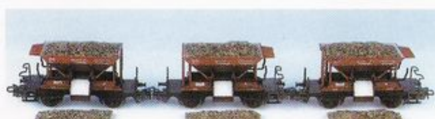
3er-Set 48113 für Mä 4610 - 48123 für FI 5505