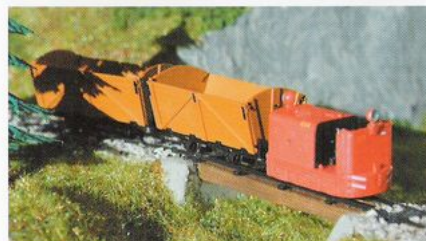
TF103 Torfbahn H0f: Lok „IDA“, 2 Torfwagen, 2 Gleis-Sets, Standmodelle

Weitere Standmodell im Programm: Loks, Hunten, Loren, Draisinen in H0f, H0e, sowie Draisinen in H0m und H0