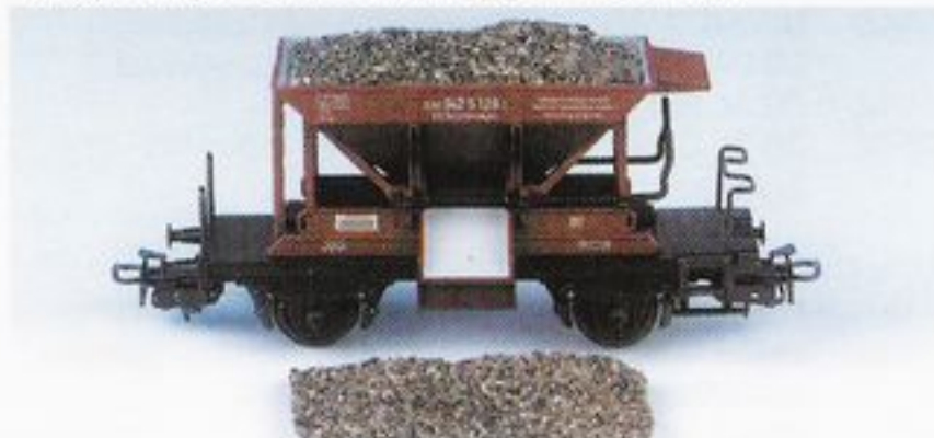
Schottereinsatz 48111 für Mä 4610 - 48121 für FI 5505

087/2 ist nur in Verbindung mit 087/1 einsetzbar, da das überlange H-Profil in den Schutzwagen mit den beiden aufgehängten Stirnwandklappen hineinragt.