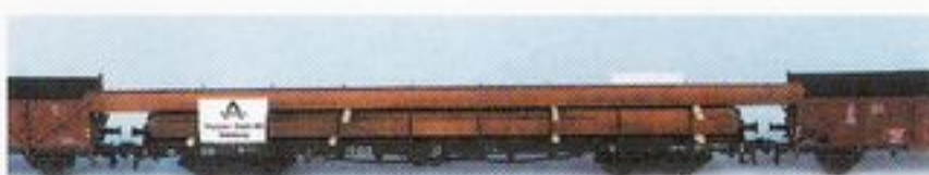
087/1 DB, Ep. III, 1 Res 680 beladen mit 4 H-Profilen und einem überlangen H-Profil ca. 320mm lang, 1 Omm37 Schutzwagen mit einer aufgehängten Stirnwandklappe und 1 Omm37 Schutzwagen mit zwei aufgehängten Stirnwandklappen.