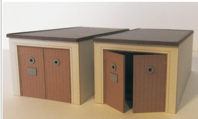
Abb. Spur H0