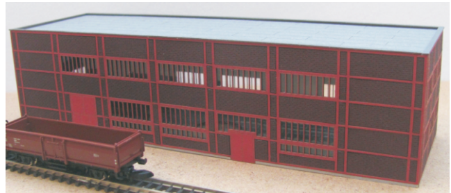
Abb. Spur Z

Bestell-Nr. N901 (Stahlfachwerk rot, Essen) (lieferbar vorauss. 2021) Bestell-Nr. N902 (Stahlfachwerk grün, Dinslaken) (lieferbar vorauss. 2021) Preis 54,90 EUR