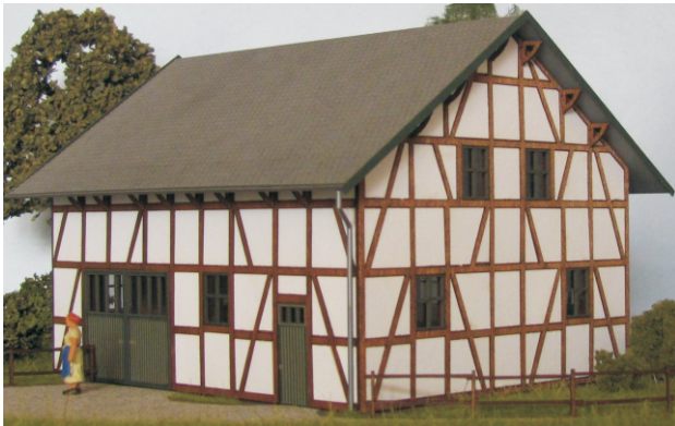
Abb. Spur H0

Bestell-Nr. N501 (lieferbar vorauss. 2021) Preis 21,90 EUR