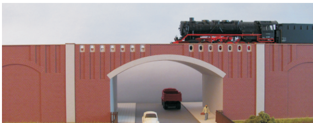
Abb. Spur H0

Bestell-Nr. N201 (lieferbar vorauss. 2021) Preis 42,90 EUR