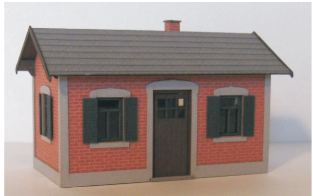
Abb. Spur H0