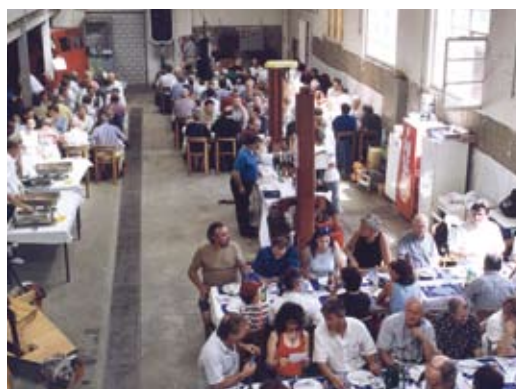
Bilder vom Ausflug am 23. August 2003: Der Fahrt mit der Ae 4/7 von Basel nach Laufenburg – und verschiedenen Fotohalten – folgte der Transfer mit einer Draisinen-Komposition zum Mittagessen im Museum der Draisinen-Sammlung Fricktal.