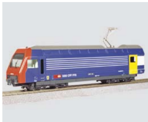
Dem abgebildeten Modell fehlen noch Schienenräumer und Seitenfenster. Diese Teile werden zur Zeit korrigiert, sollten aber bald bei uns eintreffen. Falls nichts mehr schiefliegt, kann «Art.Nr. 284~/285= Re 450» also termingerecht ausgeliefert werden.