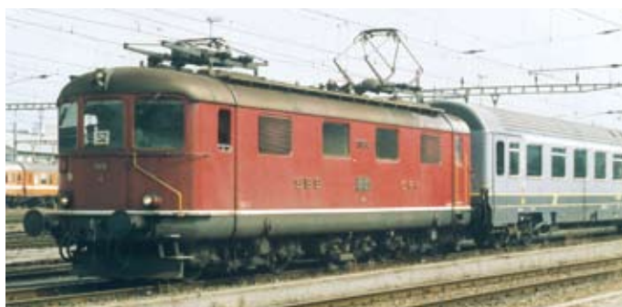
Noch im Rangiereinsatz: 10034 mit modernem FS-Material vor der Überfuhr nach Basel PB, 25.9.2000.

Entre 1958 et 1963, toute la série fut renumérotée 10001 à 10050. Dans les années 60, avec l'apparition des premières «BoBo» (Re 4/4 01 ), les Re 4/4 1 perdaient leur titre de noblesse. Les trains étaient devenus trop lourds. Les Re 4/4 1 10001 à 10026 furent alors déplacées pour assurer les trains-navettes régionaux. La série 10027 à 10050 se voyait confier les trains directs légers et un train de prestige, le TEE «Rheingold» sur le tronçon Bâle-Berne-Genève du 30.5.65 au 22.5.82. Les premières années, différentes locs de la série assuraient le parcours de cette rame «sur mesure» à 4 ou 5 voitures. En 1972 fut introduit un roulement spécial pour les 4 locomotives 10033, 10034, 10046 et 10050 arborant dorénavant la resplendissante livrée TEE. Parmi les autres trains internationaux tractés par les Re 4/4 1 , citons encore le Delémont-