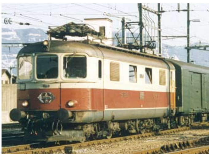
Bescheidene Aufgabe für die einstige Star-Lok 10050: Postzug Genf-Lausanne 90541 am 11.7.96.