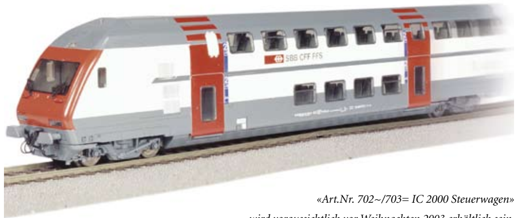
«Art.Nr. 702~/703= IC 2000 Steuerwagen» wird voraussichtlich vor Weihnachten 2003 erhältlich sein. (Beim abgebildeten Steuerwagen ist die Bedruckung noch nicht vollständig.)