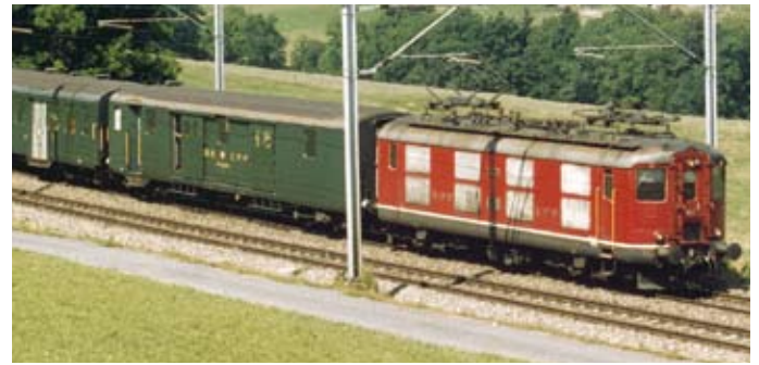
Jahrelang vor Pendelzügen: 10025 mit Regionalzug 4319 Lausanne-Lyss bei Palézieux am 4.8.94.

2. leichte Schnellzüge und der renommierte TEE «Rheingold» auf dem Abschnitt Basel-Bern-Genf vom 30.5.65 bis 22.5.82. Dieser mit 4 bis 5 Wagen massgeschneiderte Prestigezug wurde vorerst von grünen Loks gezogen. 1972 wurde ein Spezialumlauf für die Nummern 10033, 10034, 10046 und 10050 geschaffen, welche nunmehr das elegante TEE-Kleid trugen. Auch anderswo kam die 2. Serie zu internationalen Ehren: Sie führte das Zugpaar Delsberg-Delle(-Belfort-Paris) und die Zubringerzüge Bern-Neuenburg-Pontarlier(-Frasne) zum TGV nach Paris. Mit der Inbetriebnahme der Re 460 und den dadurch frei gewordenen Typen jüngerer Datums begann 1990 der unaufhaltsame Abstieg der Re 4/4 1 . Mit einigen Regionalzügen und leichten Gü-