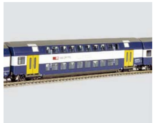
Zukunftsaussichten: Wir planen, zu einem späteren Zeitpunkt den ganzen Zug – mit den Wagen von Fleischmann – in einer Packung anzubieten.