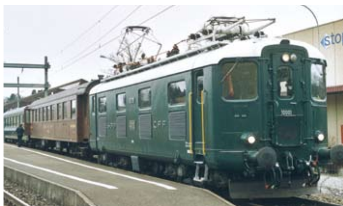
Historische 10001 auf Pressefahrt mit Dr4 25 und As 2801 in Schmitten, 20.2.2002.