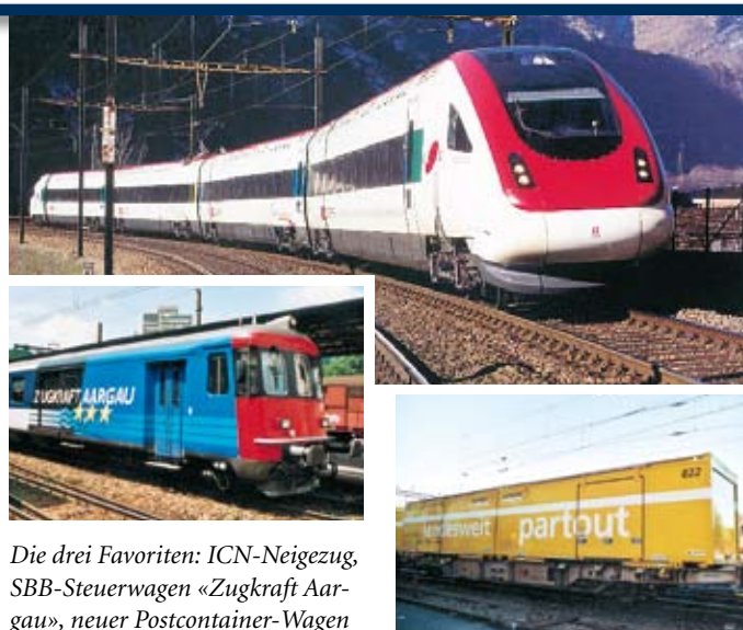
Die drei Favoriten: ICN-Neigezug, SBB-Steuerwagen «Zugkraft Aargau», neuer Postcontainer-Wagen

Das Resultat unserer Umfrage im letzten RailMail kam nicht ganz überraschend: Die meisten Leser/innen wünschten sich als nächstes HAG-Modell den ICN-Neigezug. Details zum Umfrageergebnis zeigt die nachstehende Tabelle.