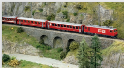
FO Start-Set „Glacier Express“

Mit den drei neuen Sets mit Gleisoval, Zahnstangenlok und je drei Personenwagen ersetzen wir die bisher erhältlichen Zahnstangensets.