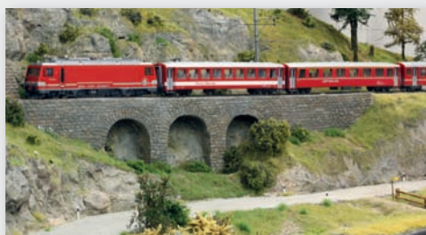
BVZ Start-Set „Glacier Express“