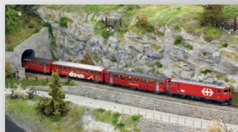
SBB Start-Set „Brünigbahn“