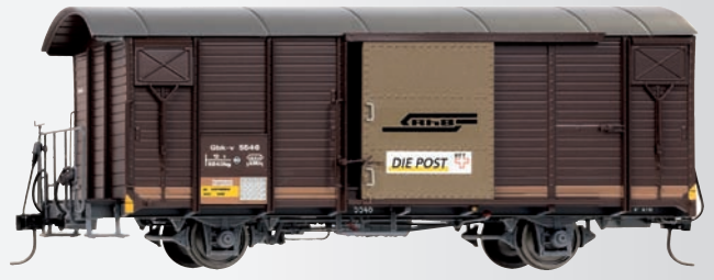
9482 116 Gbk-v 5546 für Postverkehr