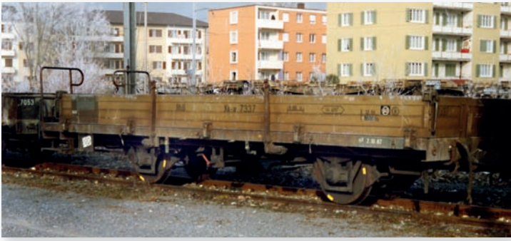
9463 107 Kk-w 7337 Niederbordwagen mit Aluwänden