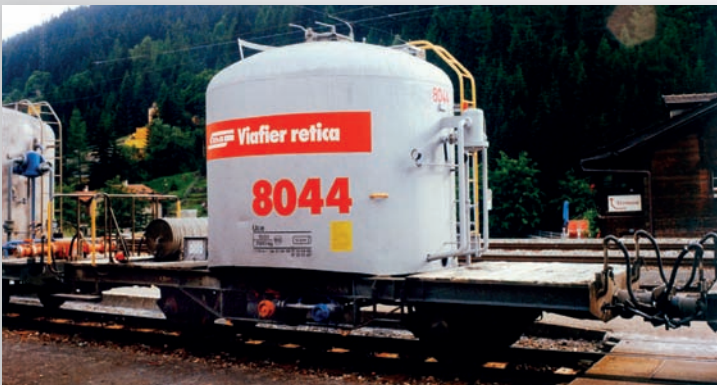
9452 134 Uce 8044 mit rotem Band