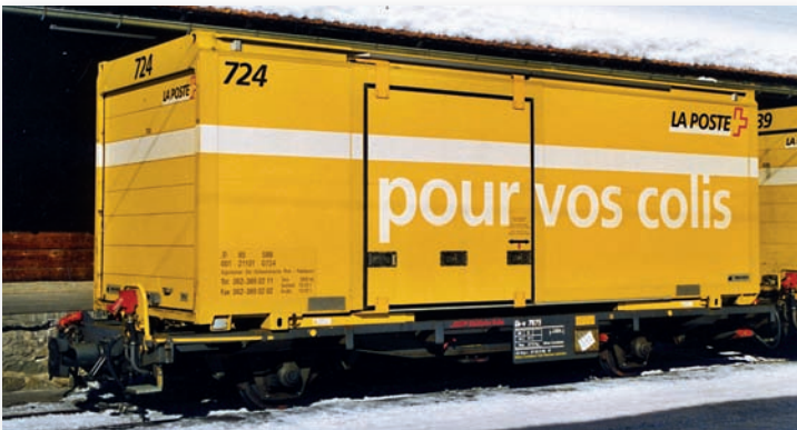
9469 105 Lb-v 7875 mit Postcontainer 724 „pour vos colis“