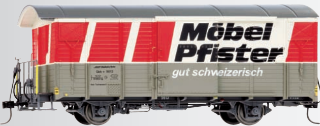
9482 123 Gbk-v 5613 Werbewagen „Möbel Pfister“