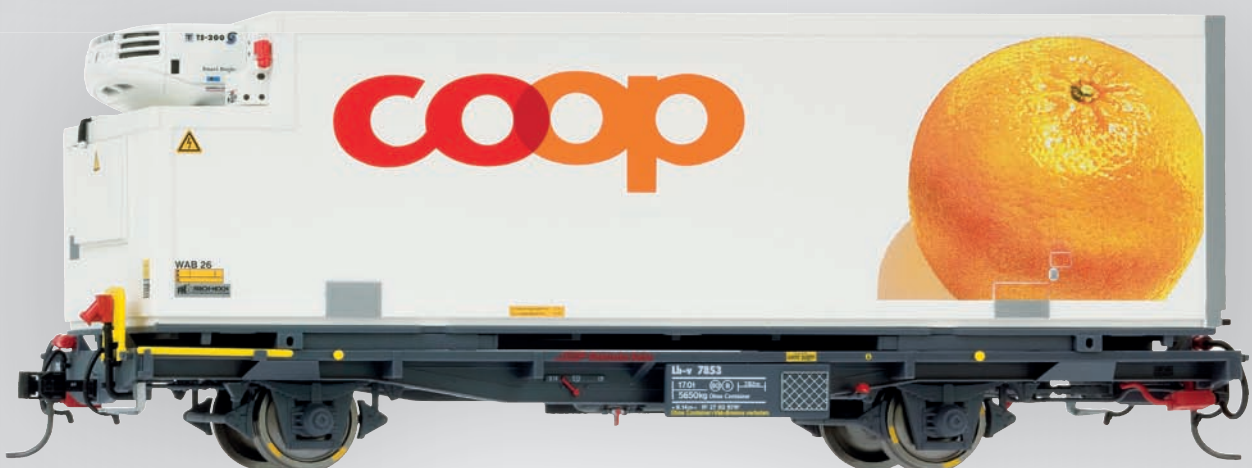
9469 113 Lb-v 7853 mit WAB 26 „Coop“ (Orange)