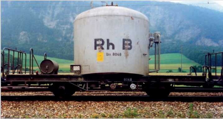
9452 118 Uce 8048 silber