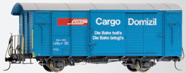
9482 125 Gbk-v 5525 Werbewagen „Cargo Domizil“