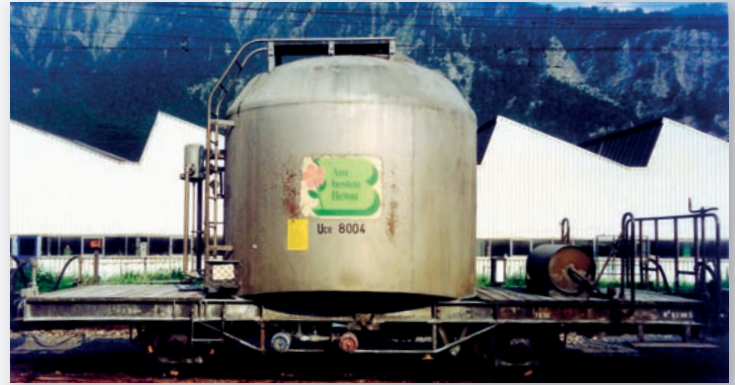
9452 114 Uce 8004 silber mit grünem B