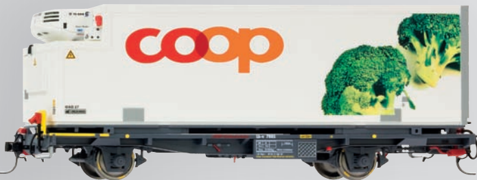
9469 115 Lb-v 7885 mit WAB 27 „Coop“ (Broccoli)