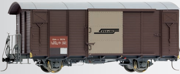
9482 114 Gbk-v 5574 braun