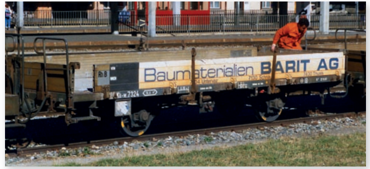
9463 124 Kk-w 7324 Niederbordwagen „BARIT AG“