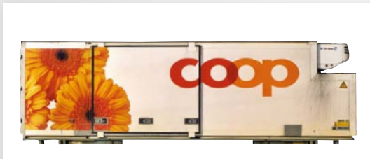
94691 10 Kühlcontainer WAB 25 „coop Gerbera“ (ohne Tragwagen)