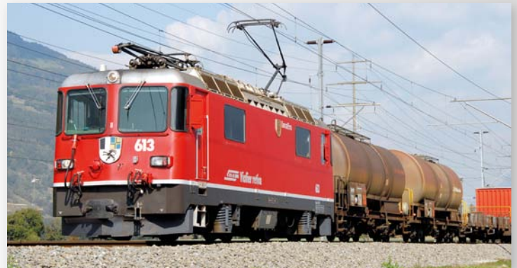
9258 153 Ge 4/4 II 613 „Domat/Ems“ Universallok rot, eckige Lampen