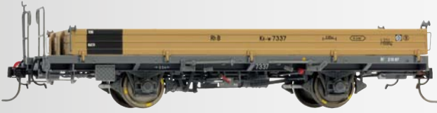
9463 107 Kk-w 7337 Niederbordwagen mit Aluwänden 9463 110 Kk-w 7340 Niederbordwagen mit Klappungen