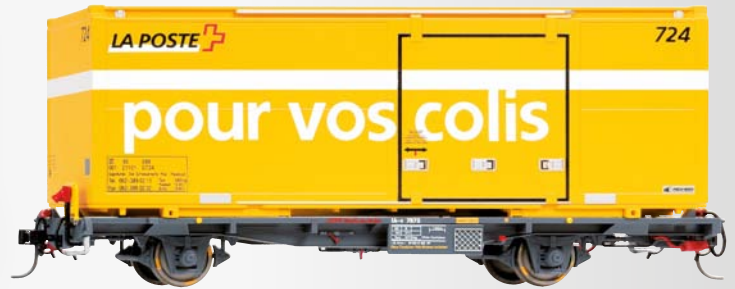
9469 105 Lb-v 7875 mit Postcontainer 724 „pour vos colis“