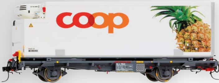
9469 112 Lb-v 7862 mit WAB 28 „coop Ananas“