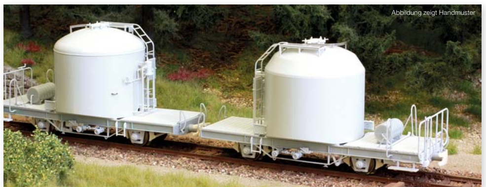
Abbildung zeigt Handmuster

Die Zementtransportwagen Uce zählen zu den markantesten Güterwagen auf Bündner Meterspurgleisen: Zwischen 1955 und 1964 wurden zunächst für Kraftwerksbauten - später auch für andere Großbauprojekte wie zuletzt den Gotthard-Basistunnel - insgesamt 100 Spezialwagen in verschiedenen Bauformen für den Transport großer Zementmengen in Dienst gestellt. Die Beladung erfolgt in den Bündner Zementwerken Untervaz. Modellausführung mit Entladeeinrichtungen innerhalb des Sprengwerk.