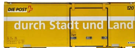
9469 100 Postcontainer 120 „durch Stadt und Land“ (ohne Tragwagen)