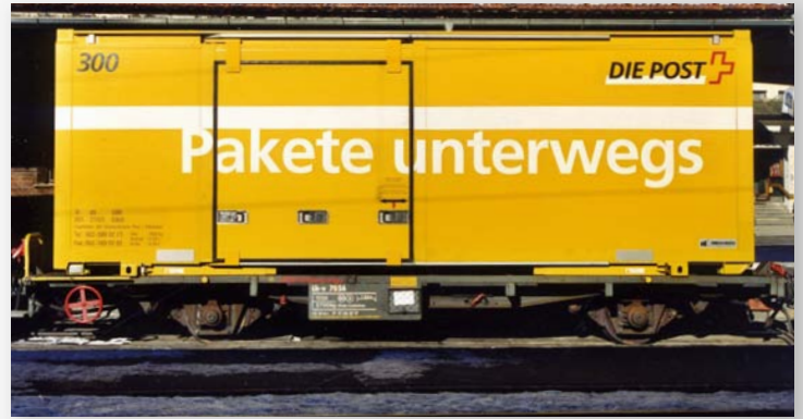
9469 106 Lb-v 7856 mit Postcontainer 300 „Pakete unterwegs“