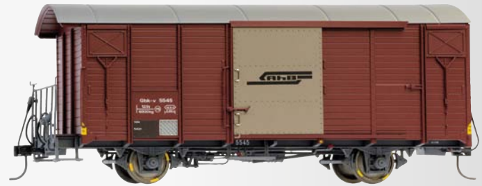
9482 115 Gbk-v 5545 ged. Güterwagen braun