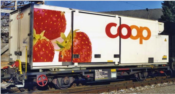
9469 118 Lb-v 7868 mit WAB 23 „coop Erdbeere“

Neuaufgabe zweier Containerwagen „Coop“ bzw. „Post“; außerdem sind zwei weitere Container einzeln erhältlich.