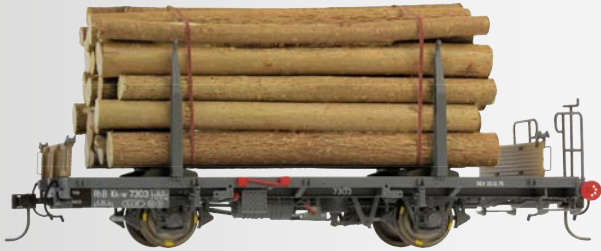
9464 102 Kk-w 7302 Holzwagen mit Holzladung 9464 103 Kk-w 7303 Holzwagen mit Holzladung