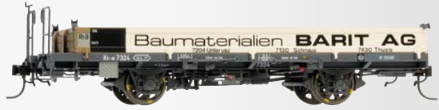
9463 114 Kk-w 7334 Niederbordwagen „BAS“ 9463 124 Kk-w 7324 Niederbordwagen „BARIT AG“