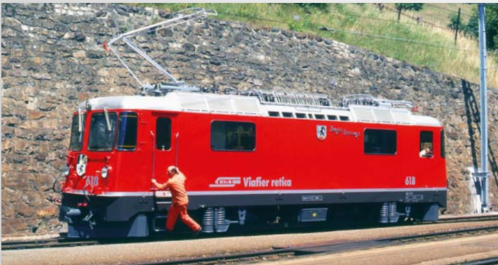
9258 128 Ge 4/4 II 618 „Bergün“ Universallok rot, runde Lampen