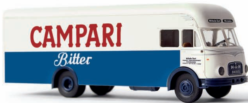
v 57526 MAN 635 Möbelwagen „Daut / Campari“