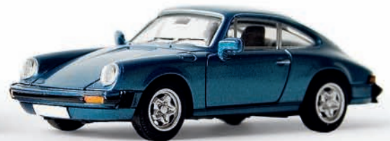
n 16301 Porsche 911 Coupé G-Reihe, petrolblau met. (4/08), TD