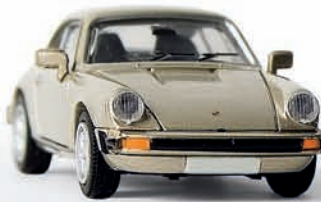
n 16302 Porsche 911 Coupé G-Reihe, casablanca beige met. (4/08), TD