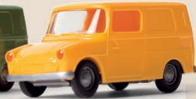
v 25909 VW Fridolin, 2 Farben sortiert