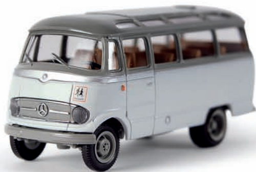
v 36173 MB 0 319 Reisebus „Schulbus Schweden“