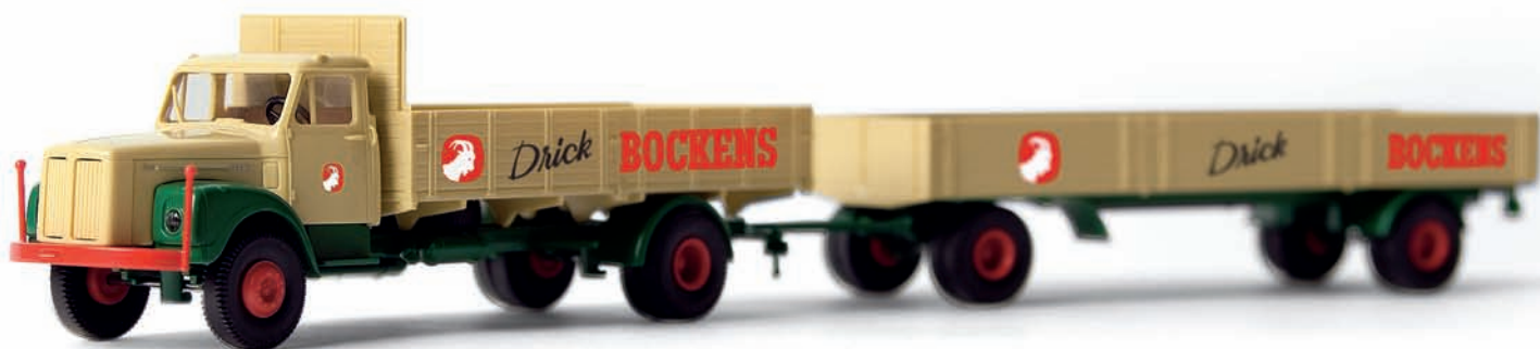
v 85115 Scania Pritschen-Zug „Bockens“