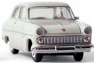
n 19301 Ford 12 M Limousine, hellgrau, TD