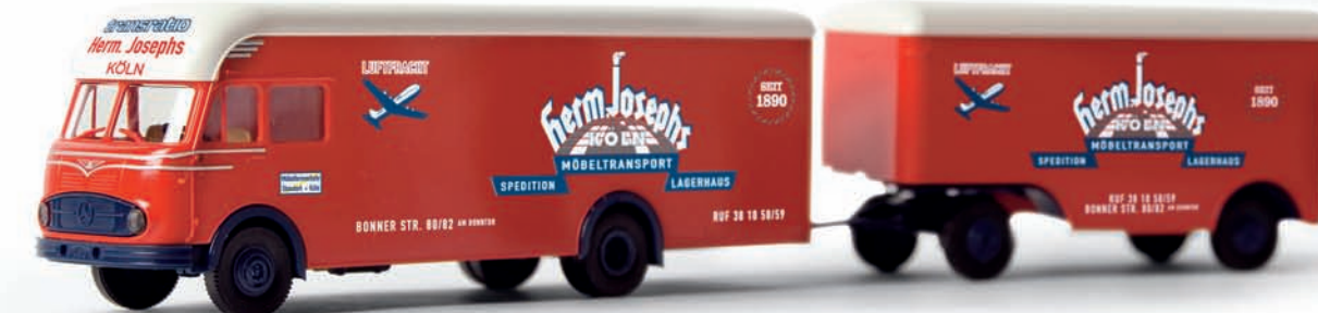
v 57211 MB LP 322 Möbelzug „Josephs“