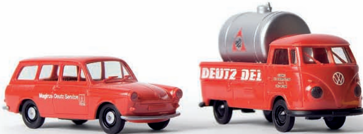
v 26521 VW Variant „Magirus-Deutz Service“