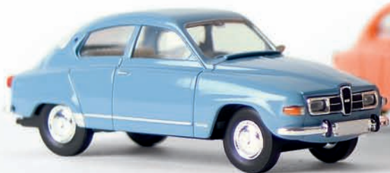
v 28505 Saab 96, pastellblau, TD