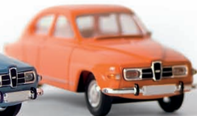
v 28504 Saab 96, orange, TD