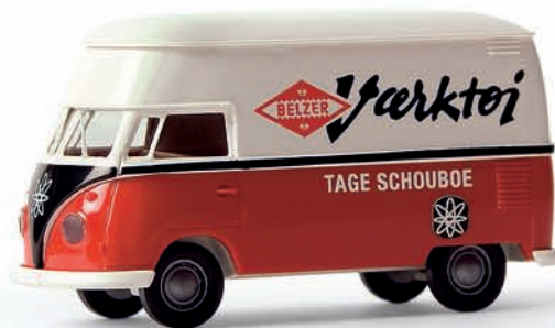
v 32606 VW T1b Großraumkasten „Belzer“ aus DK