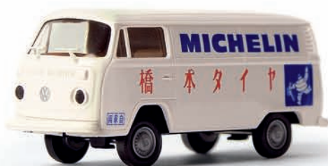
v 33511 VW T2 Kasten „Japanese tyre service“

n 12208 25. BREKINA Autoheft 2008/2009 (Jubiläumsheft mit 100 Seiten, erscheint Okt. 08)