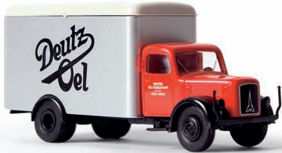
v 41008 Magirus S 3500 mit Kofferaufbau „Deutz-öl“