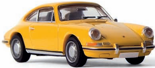
v 16215 Porsche 912 Coupé, bahamabeige, TD

Von 1965–1969 gab es unter der Verkaufsbezeichnung 912 als günstige Einstiegsmodell die Karosserie des 911 mit dem Motor des Porsche 356. Er gehörte mit seinem 4-Zylinder-Boxermotor, der lediglich 90 PS leistete, nicht zu den schnellsten auf der Autobahn. Das Modell trägt vorbildgerecht die Stahlfelgen mit Radkappen, da die wenigsten 912 mit Alufelgen geordert wurden.