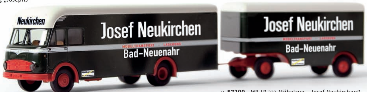
v 57209 MB LP 322 Möbelzug „Josef Neukirchen“