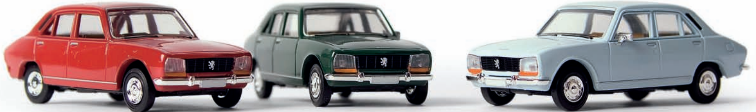
n 29100 Peugeot 504 Limousine, dkl.rot (ab 06/2008)

„Der französische Mercedes“, der Peugeot 504 wurde 1968 vorgestellt und überzeugte auch in Deutschland durch sein komfortables Fahrwerk und seine geräumige Karosserie, die während der langen Bauzeit nur in wenigen Details geändert wurde. Das BREKINA-Modell zeigt die Variante ab 1974, was Peugeot-Fans sofort an den Türgriffen erkennen. Der 504 ist bis heute das beliebteste Fahrzeug in Afrika, wo er seine Karriere als Sieger zahlreicher Rallyes begann. Bis 2001 wurde er in Kenia noch unter Peugeot-Lizenz gebaut.