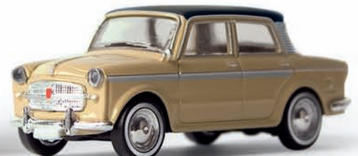
v 22209 FIAT 1200 Limousine „Grand Luce“ (Drummer)