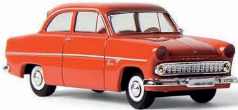
n 19300 Ford 12 M Limousine, rot, TD

Bereits 1952 verließ der erste Ford mit Pontonkarosserie, der „Weltkugel-Taunus“, das Fließband. Das Fahrzeug mit völlig neuem Raumkonzept wurde bis 1959 außen geglättet (unter anderem entfiel die Weltkugel) und innen verbessert, so dass es sich bis zum Produktionsende 1961 immer noch in Stückzahlen um 100.000/Jahr verkaufte. Das BREKINA-Modell entspricht der letzten Version von 1959–1961.