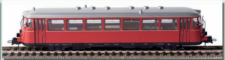
n 64001 MAN Schienenbus, VT 26 neutral DC, TD