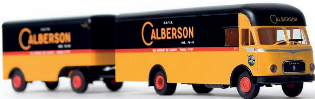
v 57524 Saviem Möbelzug „Calberson“