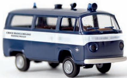
v 33116 VW T2 Kombi „Croce Bianca Milano“