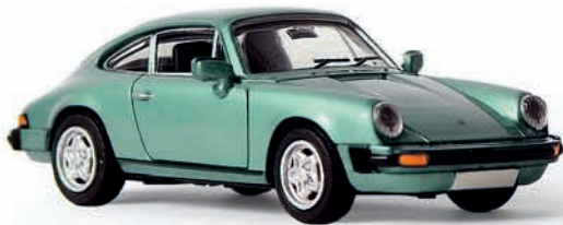
n 16300 Porsche 911 Coupé G-Reihe, lindgrün met. (4/08), TD

Unter „Gib Gummi“ durften die Ingenieure des neuen Porsche nicht nur den Druck aufs Gaspedal verstehen, sondern mussten die Sicherheitsbestimmungen der USA berücksichtigen. Diese verlangten von Sportwagen besseren Aufprallschutz, was die Zuffenhausener mit „nachgiebigen“ Stoßstangen lösten. Um die beweglichen Teile abzudecken wurden in die Stoßfänger kleine Gummi-Seitenbälge integriert. Dies gelang den Ingenieuren so harmonisch, dass sich die Baureihe äußerlich fast unverändert 16 Jahre im Programm hielt. Lediglich die Kotflügel wurden den immer breiter werdenden Reifen von Zeit zu Zeit angepasst. Das vorliegende BREKINA-Modell entspricht mit den schmalen Kotflügeln der ersten Serie bis 1978.