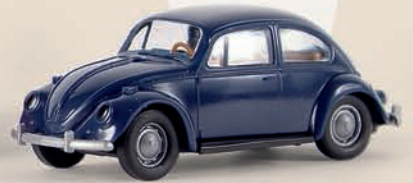
v 25013 VW Käfer Standard, 4 neue Farben sortiert