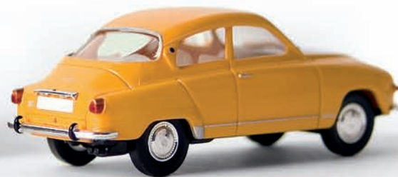
v 28503 Saab 96, maisgelb, TD