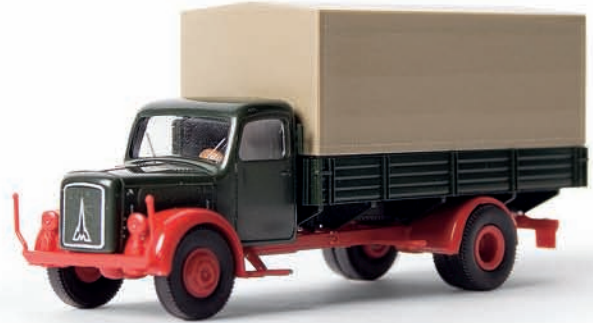
v 41005 Magirus S 3500 P/P, neue Farbe tannengrün