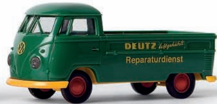
v 32934 VW T1b Pritschenwagen „Deutz“