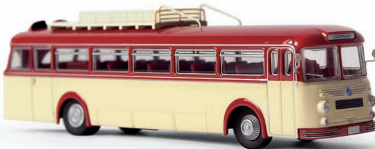
n 59300 Krauss Maffei KMO 160 Überlandbus, rot/elfenbein, TD