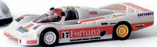
v 16113 Porsche 956L „Fortuna“