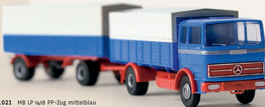
v 81021 MB LP 1418 PP-Zug mittelblau