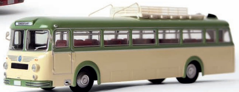
n 59301 Krauss Maffei KMO 160 Überlandbus, grün/elfenbein, TD