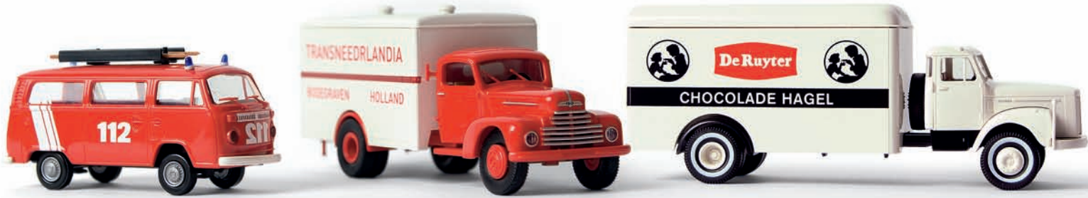
v 33110 VW T2 Kombi „Feuerwehr Luxembourg“