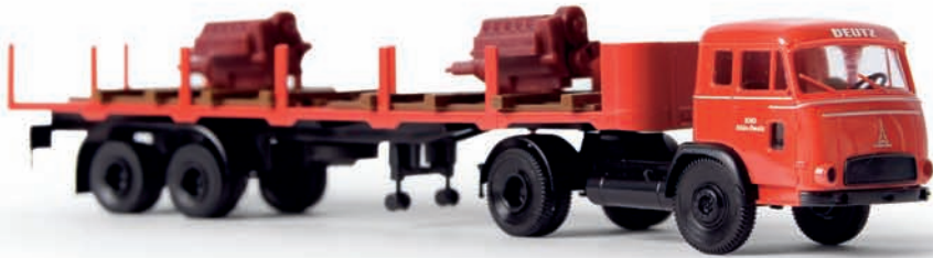
v 83209 Magirus Pluto Rungensattelzug Deutz-Motoren als Ladegut