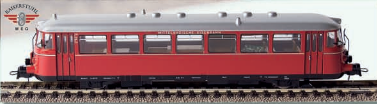
n 64000 MAN Schienenbus, VT 25 „MEG-Kaiserstuhlbahn“ DC, TD