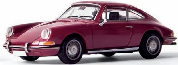
v 16216 Porsche 912 Coupé, burgundrot, TD