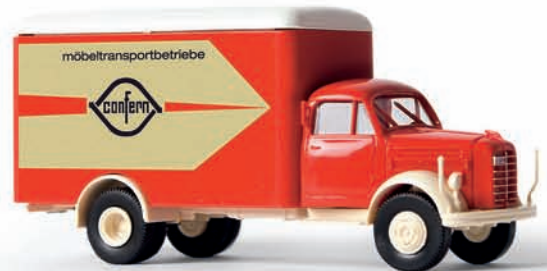
v 43016 Borgward B 4500 „Confern“