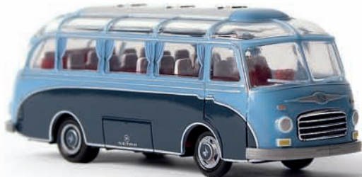
v 56006 Setra S 6 pastellblau/graublau, TD