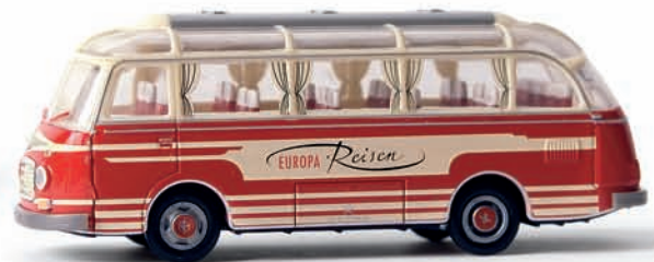
v 56007 Setra S 6 „Europa“, TD