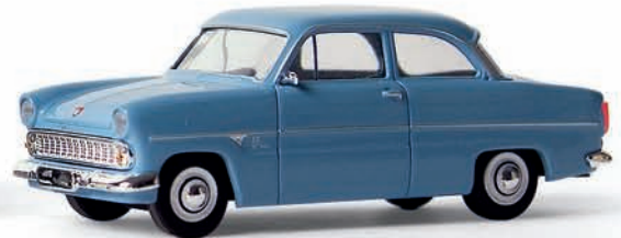
n 19302 Ford 12 M Limousine, blau, TD