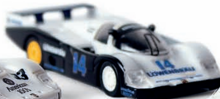
v 16115 Porsche 956L „Löwenbräu“