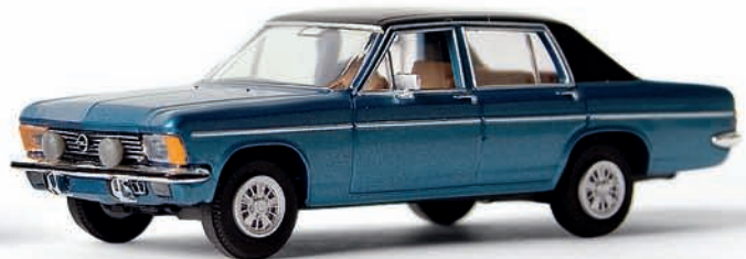
v 20716 Opel Diplomat B (1975–77) mit Ronalfelgen blaumet./schwarz, TD