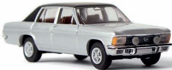
v 20715 Opel Diplomat B mit Ronalfelgen, silber/schwarz, TD

Die Spitzenmodelle der von 1969–1977 gebauten Opel KAD-Baureihe hörten auf den Namen „Diplomat“. Während er sich bis 1976 durch senkrechte Scheinwerfer von seinen Brüdern „Kapitän“ und „Admiral“ absetzte, erhielt er im letzten Baujahr noch ein Facelifting, dessen Merkmale die quer liegenden Scheinwerfer, die serienmäßige Metallic-Lackierung, das schwarze Vinyl Dach und die chicen Ronal-Felgen waren. Insgesamt wurden 61.000 Fahrzeuge der gesamten KAD-Baureihe gebaut!