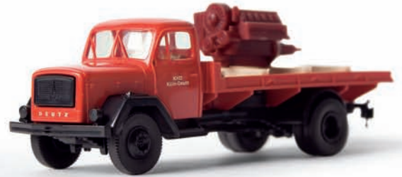
v 46007 Magirus Mercur Eckhauber mit Plattform und Deutz-Motor