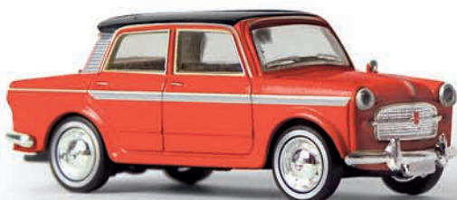
v 22207 FIAT 1200 Limousine „Grand Luce“ (Drummer)