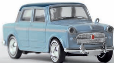
v 22208 FIAT 1200 Limousine „Grand Luce“ (Drummer)