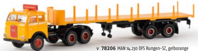
v 78206 MAN 14.230 DFS Rungen-SZ, gelborange