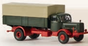
44118 MB L 4500 PP-LKW, 2 Farben sortiert