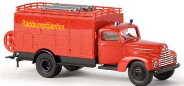
v 49012 Ford FK 3500 SKW "Räddningstjänsten"