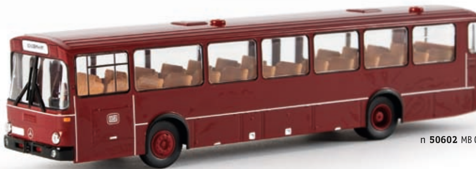
n 50602 MB O 307 Überlandbus "DB", TD