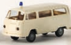
33124 VW Krankenwagen T2, hellelfenbein