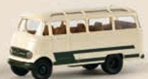
36172 MB O 319 Reisebus, 3 Farben sortiert