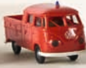
32814 VW T1b Doka "Feuerwehr", feuerrot, rubinrot