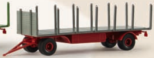
v 55256 2achs Rungenanhänger, 3 Farben sortiert