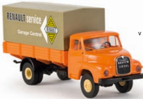
v 45030 Saviem Kurzhauber PP "Renault Service"