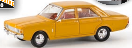
n 19402 Ford 17m (P7b), narzissengelb, TD