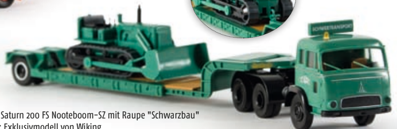
v 83215 Magirus Saturn 200 FS Nooteboom-SZ mit Raupen "Schwarzbau" Ladegut: Exklusivmodell von Wiking