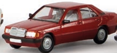
13201 MB 190 E, rot