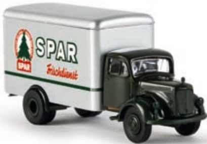
v 40011 MB L 311 Koffer "Spar Frischdienst"