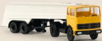
81025 MB LPS 1620 Tanksattelzug, 2 Farben sortiert