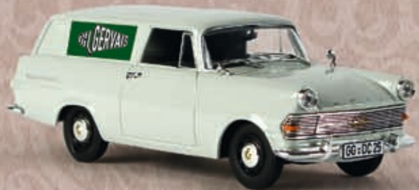
v 69983 Opel P 2 Kasten "Gervais"