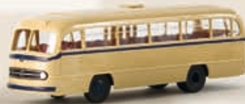
52367 MB O 321 H Stadtbus, 3 Farben sortiert