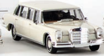
13002 MB 600, weiß