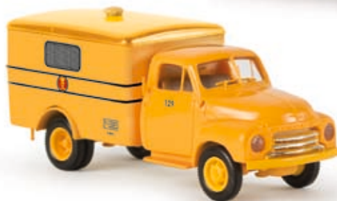
v 35307 Opel Blitz Koffer "Dänische Post"