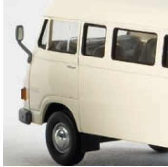
n 13251 MB L 206 D Kombi, weiß