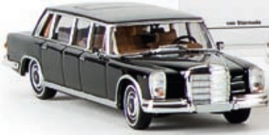
13003 MB 600, schwarz

M Modellfahrzeug des Jahres 2009 Mercedes-Benz 600