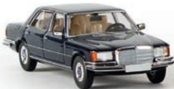
13150 MB 450 SEL, schwarzblau