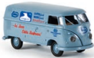
v 32563 VW Kasten T1b "Edeka Tiefkühlkost"