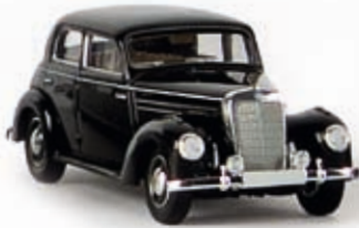
13050 MB 220, schwarz