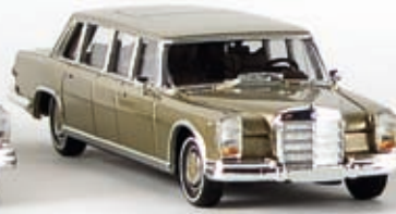
13004 MB 600, gold-metallic