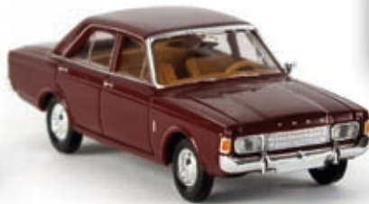
n 19401 Ford 17m (P7b), weinrot, TD