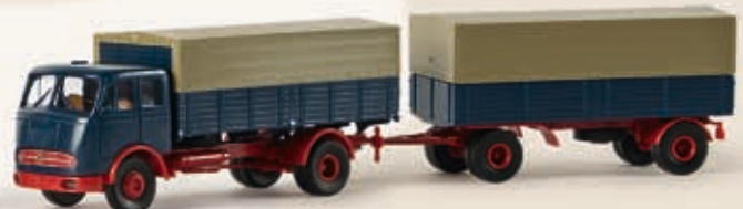
76004 MB LP 334 PP-Zug, 2 Farben sortiert