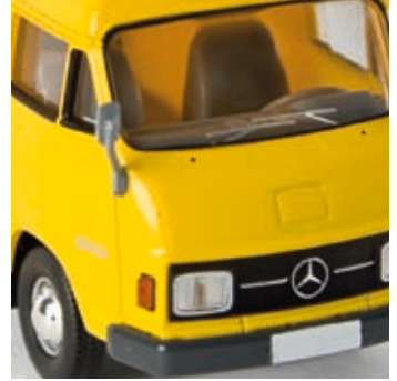
n 13301 MB L 206 D Kasten, gelb