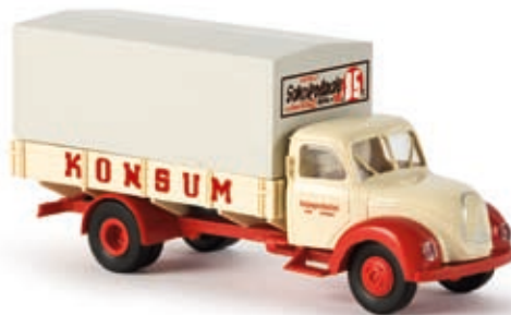
v 42223 Magirus Mercur PP "Konsum Schokolade"