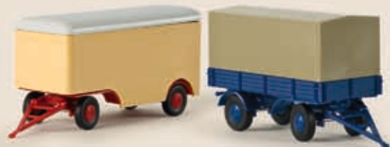
v 55257 Möbelanhänger, beige v 55233 PP-Leichtanhänger, dunkelbau