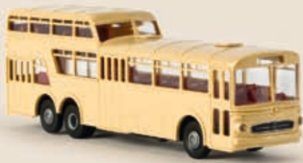
v 61012 MB O 317 Anderthalbdecker Bus, beige