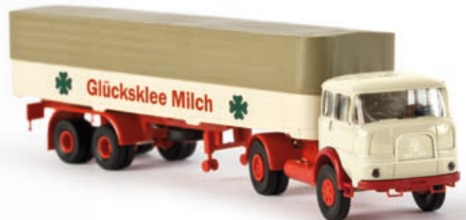
v 84115 Krupp SF 980 PP-Sattelzug "Glücksklee Milch"