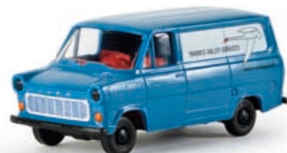
v 34156 Ford Transit IIb Kasten "Thames Valley Services"