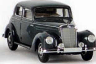
13051 MB 220, graphitgrau