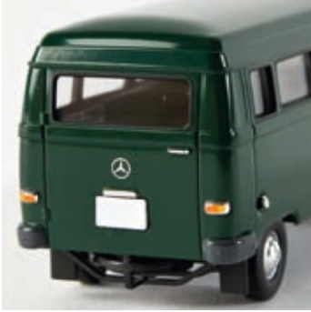
n 13250 MB L 206 D Kombi, grün

werden konnte, wurde lediglich der Vorderbau geringfügig verlängert, auf dem nun der Mercedes-Stern prangte. Von 1970-1977 konnten immerhin 165.000 Transporter dieser Baureihe verkauft werden.