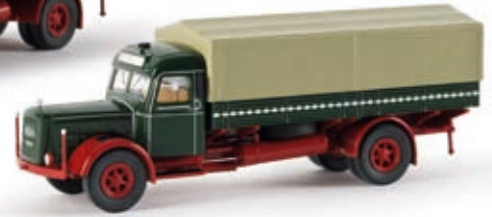
v 86107 Kaelble K 832 L PP-LKW, tannengrün/rubinrot, TD