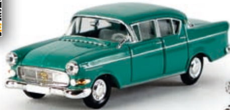
n 20831 Opel Kapitän P 2.5, minttürkis, TD