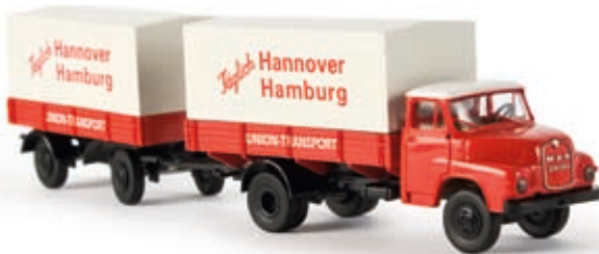
v 45029 MAN 635 PP-Zug "Union Transport"