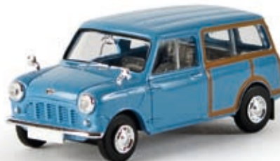
v 15305 Austin Mini Countryman "Woody", pastellblau (LHD), TD