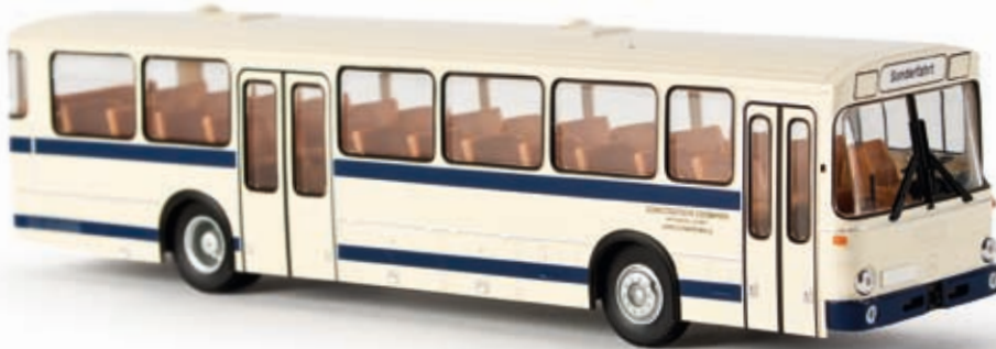
n 50601 MB O 307 Überlandbus "SWEG", TD

Der "StüLB", der "Standard-Überland-Linienbus" von Mercedes-Benz aus dem Jahr 1973 nun zum ersten Mal im BREKINA-Programm!