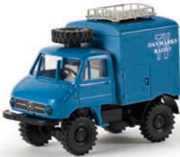
v 39018 Unimog 4x4 Koffer "Danmarks TV"