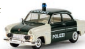
v 19308 Ford 12m "Polizei", TD