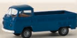
33920 VW T2 Pritsche, 2 Farben sortiert