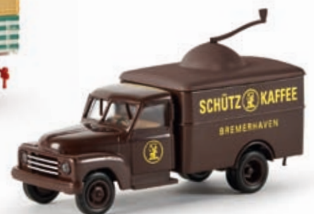
v 37117 HA L 28 Koffer "Schütz Kaffee"