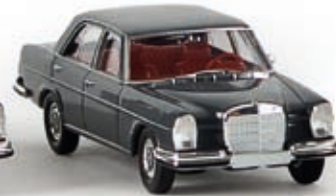
13102 MB 280 SE, graphitgrau