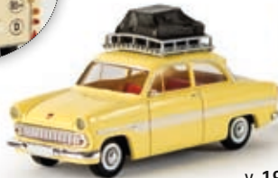
v 19309 Ford 12m, blassgelb mit Eriba Wohnwagen "Capri", TD