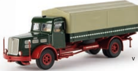
v 86203 Faun L 8 L PP-LKW, tannengrün/rubinrot, TD