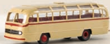
52368 MB O 321 H Reisebus, 3 Farben sortiert