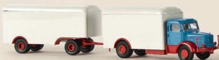
77137 Krupp Mustang Koffierzug, brilliantblau/rubinrot