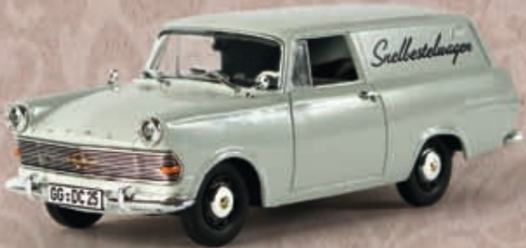
v 69982 Opel P 2 Kasten "Snelbestelwagen"