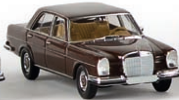
13101 MB 280 SE, dunkelbraun