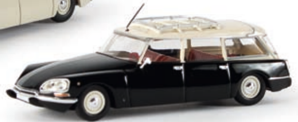
v 14205 Citroën DS Break schwarz/weiß, TD