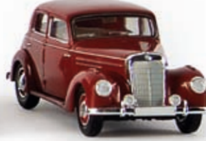
13052 MB 220, rubinrot