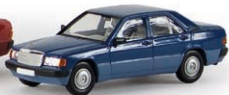
13202 MB 190 E, blau