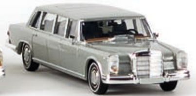
13005 MB 600, silber-metallic