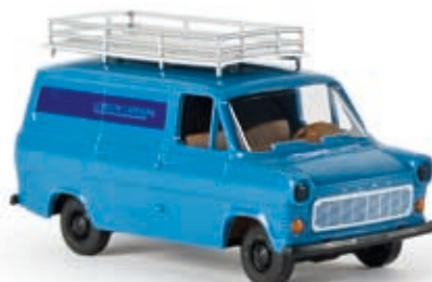
v 34155 Ford Transit IIb Kasten "London Carriers"