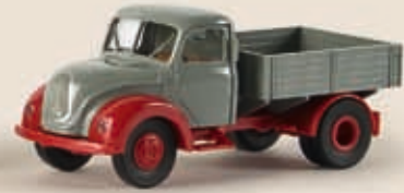
v 42221 Magirus Mercur Zugmaschine, 3 Farben sortiert