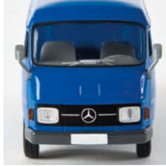
n 13300 MB L 206 D Kasten, blau