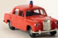
23300 MB 180 Limousine "Feuerwehr" Kommandowagen