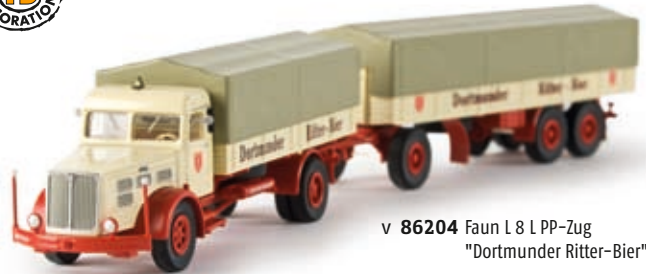
v 86204 Faun L 8 L PP-Zug "Dortmunder Ritter-Bier", TD