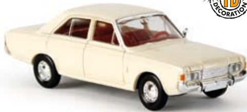
n 19400 Ford 17m (P7b), cremeweiß, TD