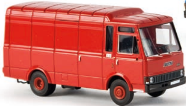
n 34500 Fiat Zeta Kasten, karminrot