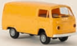
v 33513 VW Kasten T2, gelborange (neue Farbe)