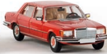
13152 MB 450 SEL, kaminrot