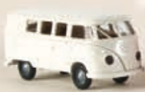
31524 VW T1b Kombi, 2 Farben sortiert