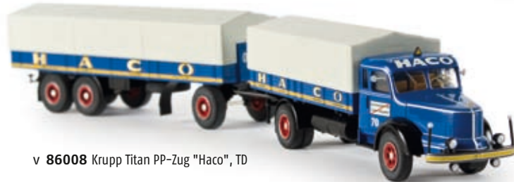
v 86008 Krupp Titan PP-Zug "Haco", TD