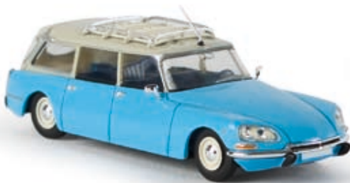
v 14203 Citroën DS Break hellblau/grau, TD