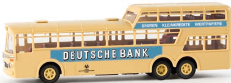
v 61016 MB O 317 Anderthalbdecker Bus "KVG Hameln/Deutsche Bank", TD