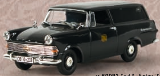
v 69981 Opel P 2 Kasten "DB"