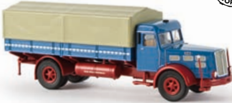
v 86202 Faun L 8 L PP-LKW, brillantblau/rubinrot, TD