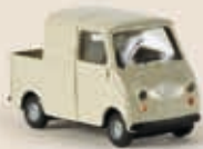
27900 Goggo Pick-up, 2 Farben sortiert