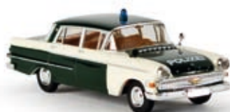
v 20804 Opel Kapitän P 2.6 "Polizei", TD