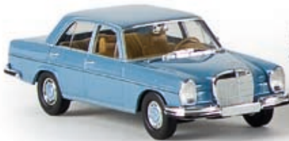
13100 MB 280 SE, pastellblau