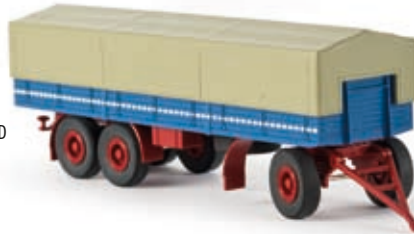
v 55700 3achs PP-Anhänger, brillantblau/rubinrot, TD