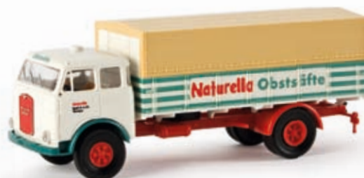
v 78357 MAN 10.212 F PP-LKW "Naturella"