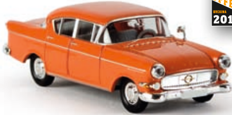
n 20830 Opel Kapitän P 2.5, lachsorange, TD