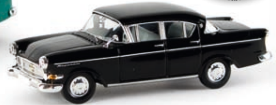
n 20832 Opel Kapitän P 2.5, schwarz, TD