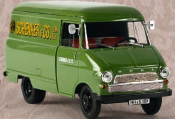
69991 Opel Blitz Kasten A "Schenker"