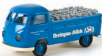
v 32937 VW Pritsche T1b "Breisgaumilch" mit Ladegut!