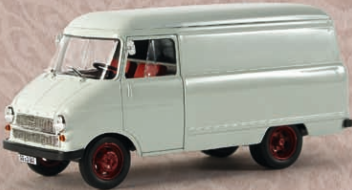
69990 Opel Blitz Kasten A, lichtgrau