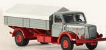
73308 Henschel HS 140 mit Spitzplane, 3 Farben sortiert