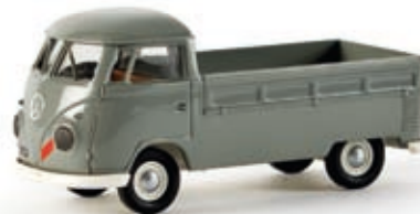
32926 VW Pritsche Tib "Italien" (mausgrau) - wieder da -