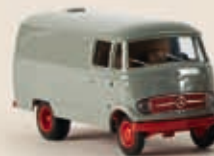
36014 MB L 319 Kasten, 2 Farben sortiert