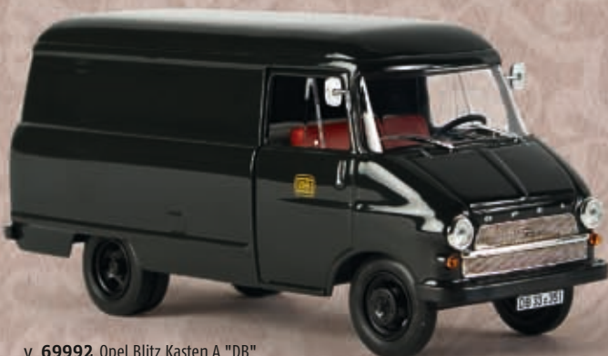
v 69992 Opel Blitz Kasten A "DB"