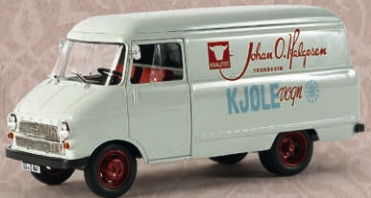
v 69993 Opel Blitz Kasten A "Helgesen"