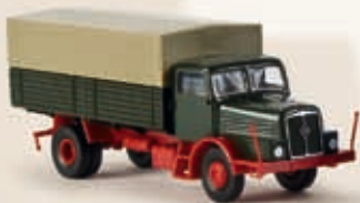
71023 IFA H 6 PP-LKW, 2 Farben sortiert