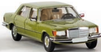
13151 MB 450 SEL, olivgrün