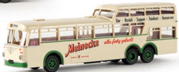
v 62014 Büssing Anderthalbdecker Bus "Stadtwerke Braunschweig/Meinecke", TD