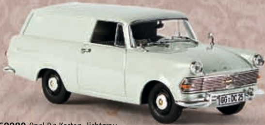
69980 Opel P 2 Kasten, lichtgrau