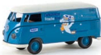
v 32562 VW Kasten T1b "Rewe Tiefkühlkost"