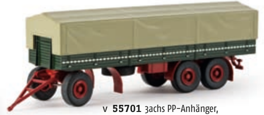
v 55701 3achs PP-Anhänger, tannengrün/rubinrot, TD