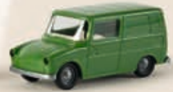
25909 VW Fridolin, 2 Farben sortiert