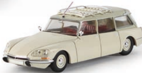
v 14204 Citroën DS Break weiß/grau, TD