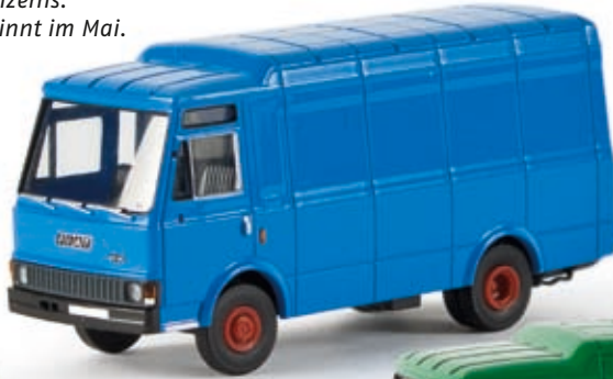
n 34501 Fiat Zeta Kasten, himmelblau