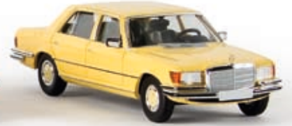
13153 MB 450 SEL, hellgelb