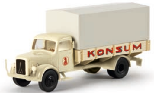
v 41010 Magirus S 3500 PP "Konsum"