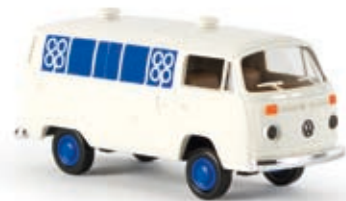
v 33519 VW Kasten T2 "Coop"