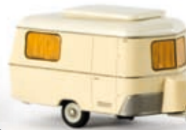
n 20808 Opel Kapitän P 2.6, elfenbein mit Eriba Wohnwagen "Capri", TD