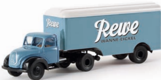
v 42222 Magirus Mercur Koffersattelzug "Rewe Wanne-Eickel"