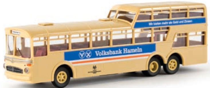
v 61015 MB O 317 Anderthalbdecker Bus "KVG Hameln/Volksbank", TD

Die Anderthalbdecker aus dem BREKINA-Programm erfahren erstmals eine Aufwertung zu TD-Modellen: Durch umfangreichere Bedruckung, hochwertigere Felgen und eine stabilere Verpackung werden die Klassiker aus den 60er-Jahren zu wahren Schmuckstücken!