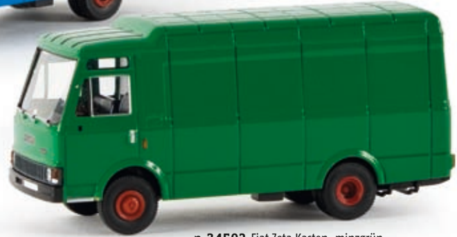
n 34502 Fiat Zeta Kasten, minzgrün