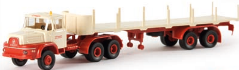
v 84017 Krupp Cummins Hauber Rungen-SZ "Pieper"