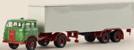
78205 MAN 10.212 FS Koffersattelzug, 2 Farben sortiert