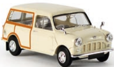
v 15304 Austin Mini Countryman "Woody", weiß (RHD), TD

Als Neuheit erscheint der Mini Countryman nun in der beliebten Variante des "Woody".