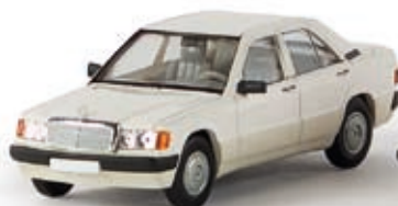
13200 MB 190 E, weiß