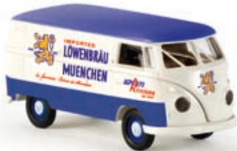
v 32561 VW Kasten Tib "Löwenbräu Italien"