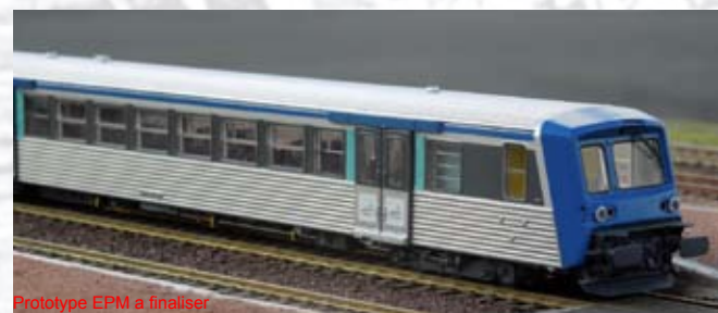
Prototype EPM à finaliser

BDx + Bz + AB, bleu foncé / inox, Modernisée, logo casquette, logo TER, 3 éléments, Région Rhone-Alpes, 4 phares, n° 34