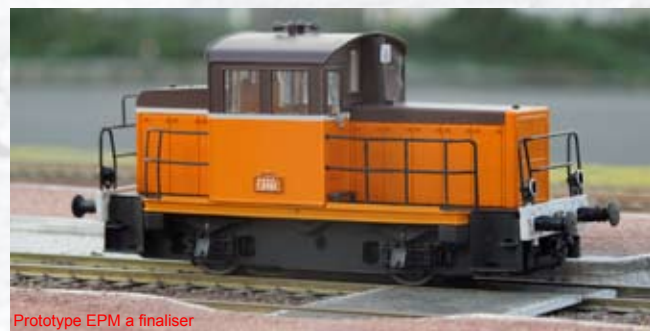
Prototype EPM à finaliser

Y 6499, orange Arzens, traverse blanche, châssis noir. version sonorisée