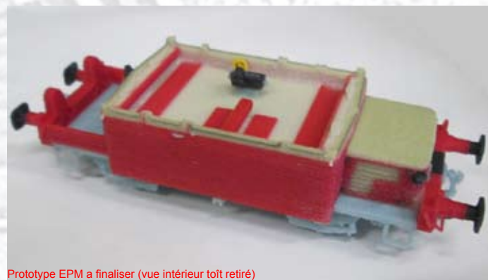
Prototype EPM a finaliser (vue intérieur toit retiré)

E 11.11.04 Ep. V DU 65 + Lorry, jaune, avec lorry de service