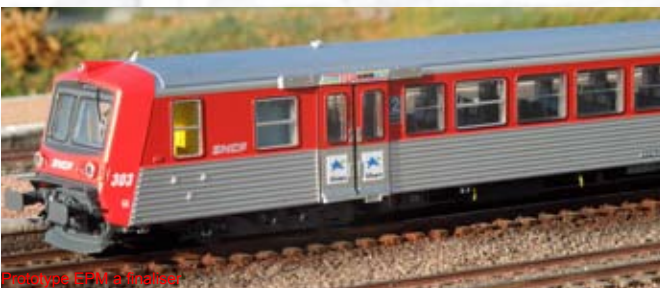
Prototype EPM à finaliser

BDx + Bz + AB, rouge / inox, logo nouilles, logo TER, 3 éléments, Région Alsace, 5 phares, n°303