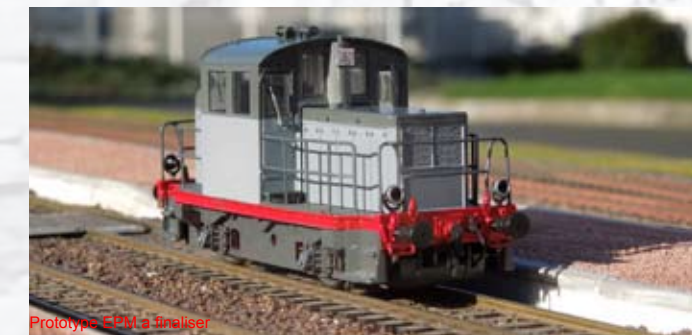
Prototype EPM à finaliser