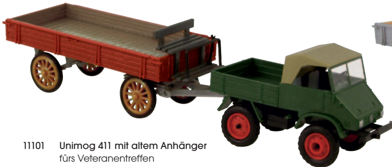
11101 Unimog 411 mit altem Anhänger fürs Veteranentreffen