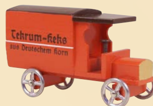
Nr. 22 Tekrum-Lieferwagen