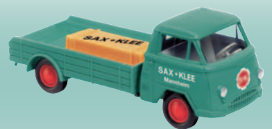
20618 Bau-Tiefflader „Sax & Klee“