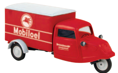
08514 Hanseat „Mobilol“ aus Hamburg