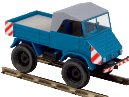
11031 Unimog Zweibegefahrzeug mit Michelin-bereiften Schienenrädern von Ries, Bruchsal