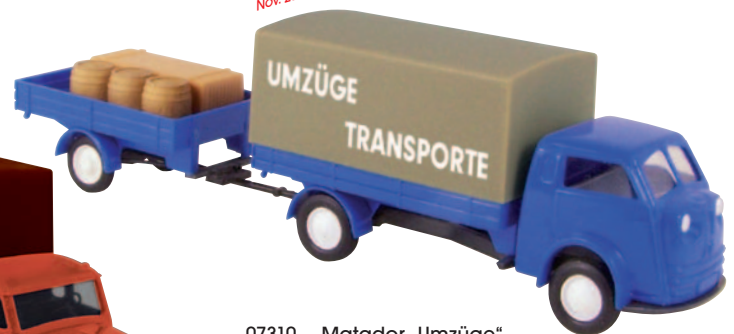
07310 Matador „Umzüge“ mit beladenem Anhänger