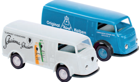
09134 Matador 1400 „Schauma“ von Schwarzkopf, heute Henkel