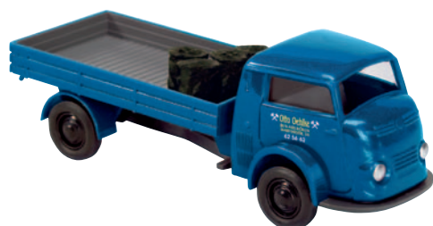
09310 Matador 1400 „Otto Oehlke“ Kohlen aus Berlin-Neukölln