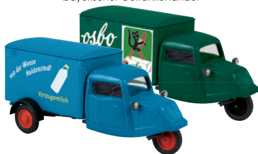
08509 Hanseat „von der Wense“ einer privaten Molkerei