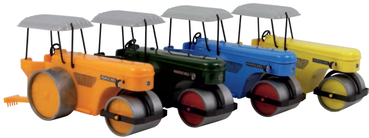
20114 Henschel MW 80/100 Kundenfarbe orange 20113 Henschel MW 80/100 Kundenfarbe grün 20121 Henschel MW 80/100 Kundenfarbe blau 20122 Henschel MW 80/100 Werksfarbe gelb