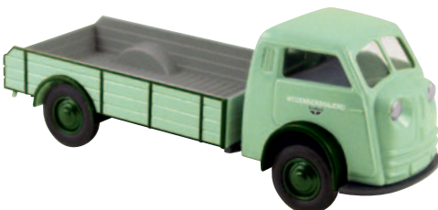
07411 Matador „Weizenbierbrauerei“ für die Autostadt Wolfsburg restauriert