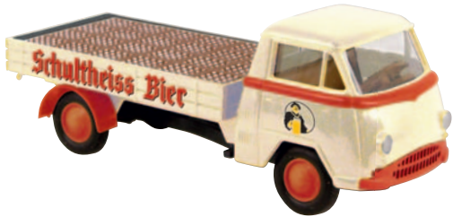
10340 Matador I „Schultheiss“ Berliner Bier