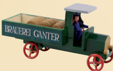
Nr. 17 Bier-Lastwagen