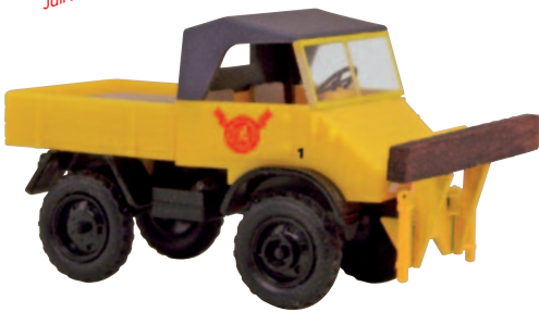
11048 Unimog „Cardinal“ Brauerei-Rangierfahrzeug