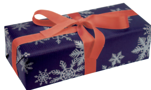
10012 Weihnachtsüberraschungsmodell 2012