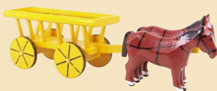
Nr. 20 Fuhrwerk 1850, Nachbau des ältesten bekannten Miniaturfahrzeugs