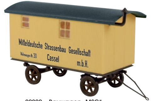
20220 Bauwagen „MSG“ aus Cassel, 1926 noch Cassel