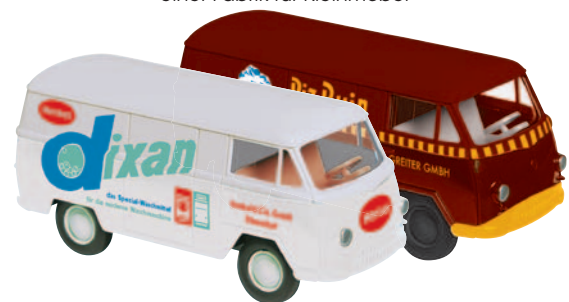
10157 Matador I „Dixan“ für Waschvollautomaten 10158 Matador I „Piz Buin“ fotografiert in Mannheim