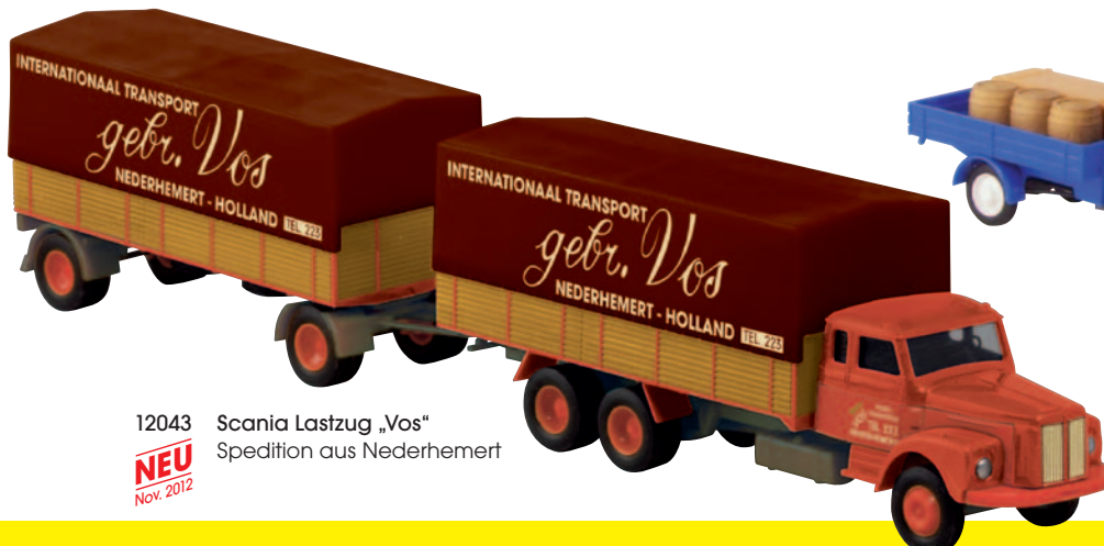
12043 Scania Lastzug „Vos“ Spedition aus Nederhemert