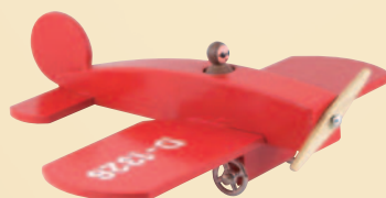
Nr. 18 Flugzeug