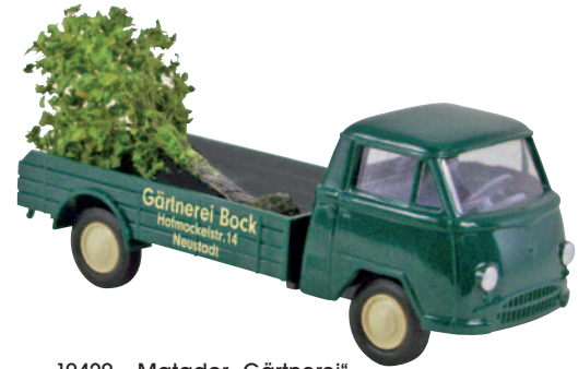
10420 Matador „Gärtnerei“ mit einem Ahornsetzling