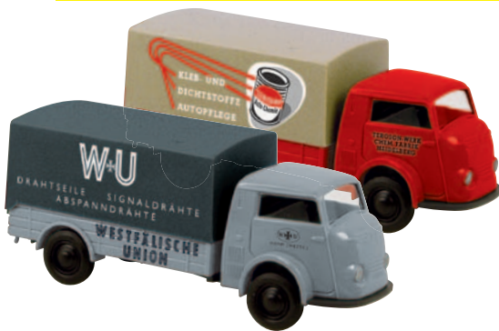
09411 Matador 1400 „Westfälische Union“ Drahtwerk in Hamm 09410 Matador 1400 „Teroson“ Autochemie aus Heidelberg