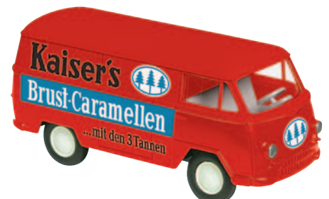
10164 Matador I „Kaiser's“ Brust-Caramellen aus Waiblingen