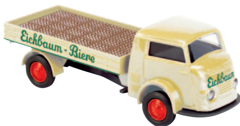
09311 Matador 1400 „Eichbaum“ Mannheimer Bier