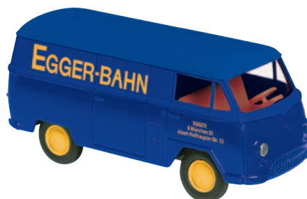
10166 Matador I „Egger-Bahn“ Kundendienstfahrzeug NEU März 2012