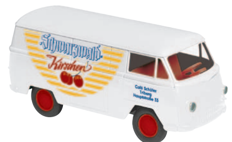
10167 Matador I „Café Schäfer“ wirbt für Pralinen am Stiel NEU Sept. 2012