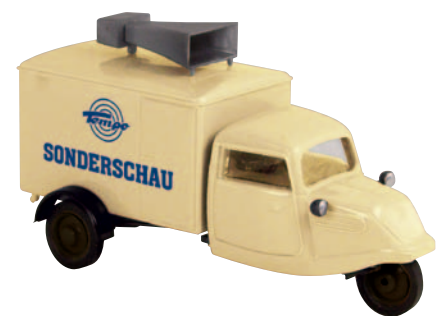
08508 Hanseat „Sonderschau“ der Tempo-Werbekarawane