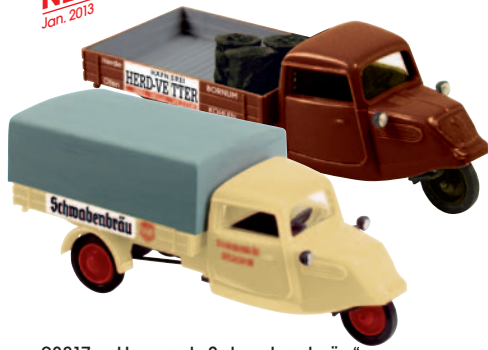
08317 Hanseat „Schwabenbräu“ der Düsseldorfer Brauerei