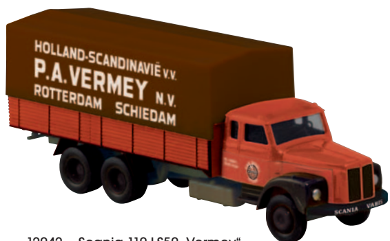
12042 Scania 110 LS50 „Vermey“ Spedition aus Rotterdam