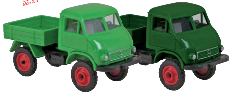
13002 Unimog 412 maigrün mit Fahrerhaus B