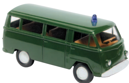
10215 Polizei-Kombi für Unfallaufnahme