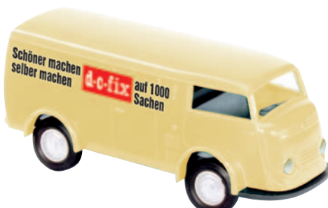
09142 Matador 1400 „d-c-fix“ wirbt für Deko-Folien