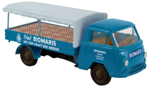
10337 Matador I „Biomaris“ aus Bremen