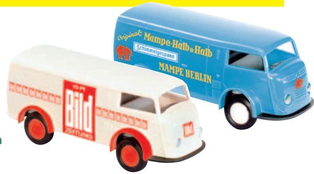
09113 Matador 1400 „Bild“ lief in Hamburg