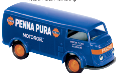
09139 Matador 1400 „Fuchs“ Motoröl aus Mannheim