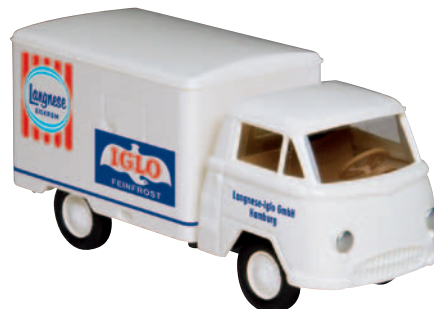
10610 Matador I „Langnese Iglo“ Eis und Gemüse