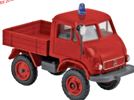
13007 Unimog FhB Feuerwehr