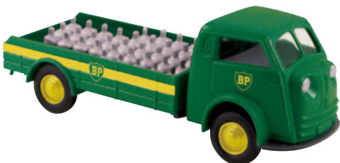
07407 Matador „BP Flaschengas“ mit Gasflaschen