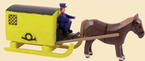
Nr. 19 Postschlitten