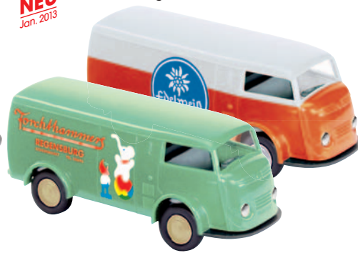
09129 Matador 1400 „Forchhammer“ des Regensburger Spielwarenladens