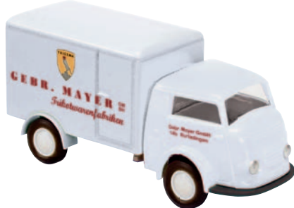
09511 Matador 1400 „Trigema“ fertigt bis heute nur in Deutschland