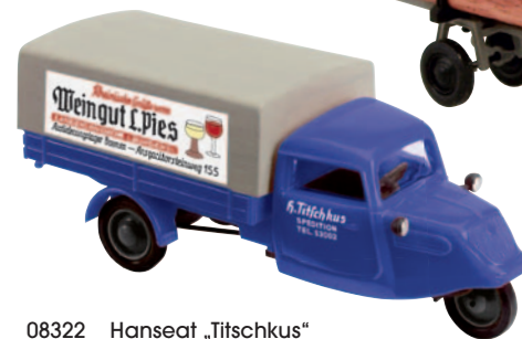
08322 Hanseat „Tischkus“ Bremer Spedition und Lager