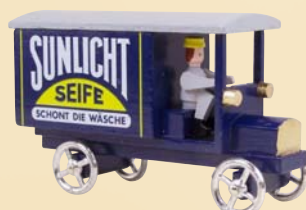
Nr. 21 Sunlicht-Lieferwagen