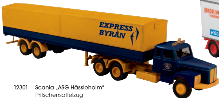
12301 Scania „ASG Häsleholm“ Pritschensattelzug