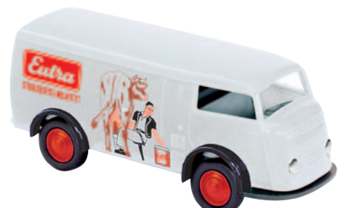
09140 Matador 1400 „Eutra“ Melkfett aus Kehl