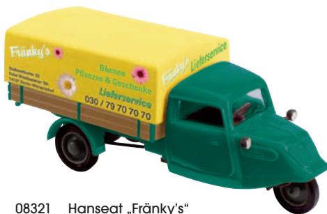
08321 Hanseat „Fränky's“ läuft heute in Berlin