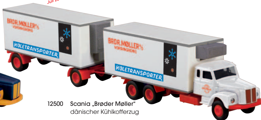
12500 Scania „Brøder Møller“ dänischer Kühlkofferzug