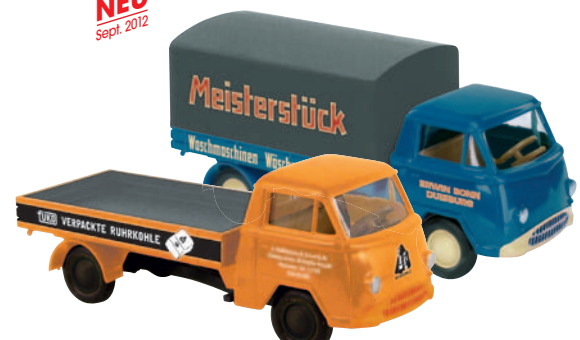
10335 Matador I „Tütenkohle“ lief in Düsseldorf 10331 Matador I „Meisterstück“ aus Duisburg