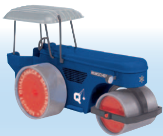
20116 Henschel MW „August Quakernack“