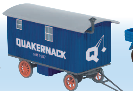
20216 Bauwagen „August Quakernack“