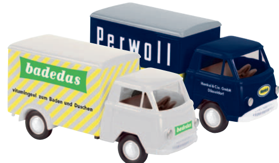
10514 Matador I „Badedas“ heute von Sara Lee