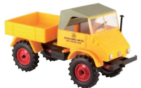
11040 Unimog „MB of Canada“ Vorführfahrzeug in Toronto