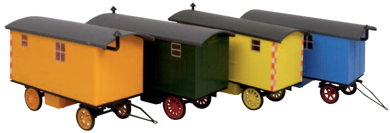
20214 Bauwagen Flohr & Sohn, orange 20213 Bauwagen mit Bake, grün 20212 Bauwagen mit Bake, gelb 20211 Bauwagen Flohr & Sohn, blau