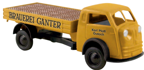
07308 Matador „Ganter“ der Bierniederlage Pfaff, Gutach