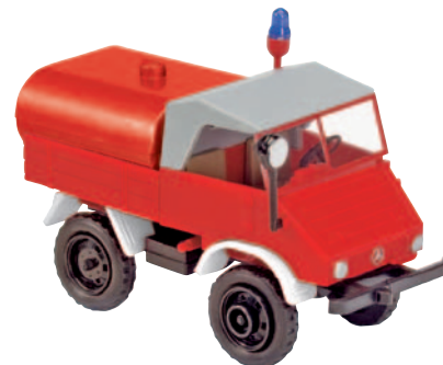
11021 Unimog Feuerwehr mit Löschwassertank, Epoche IV