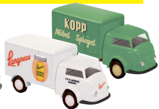
09507 Matador 1400 Koffer „Langnese-Honig“ heute in Bargtheide 09509 Matador 1400 „Kopp“ einer Fabrik für Kleinmöbel