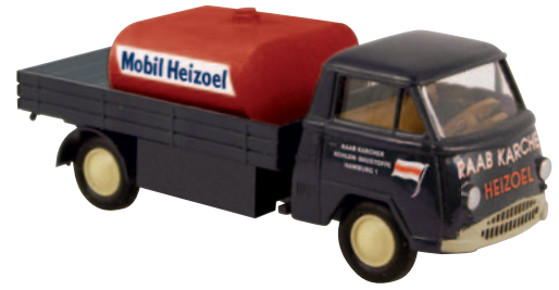
10339 Matador I „Raab Karcher“ mit Mobil-Heizoel