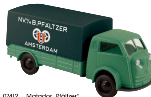
07412 Matador „Pfaltzer“ Maschinenhandel in Amsterdam