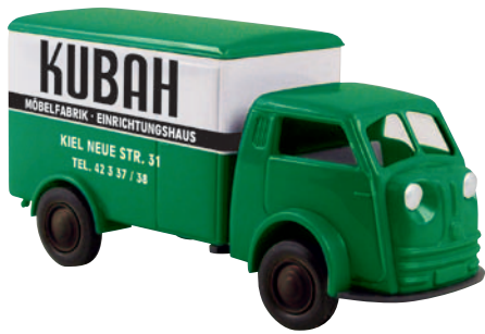
07508 Matador „Kubah“ des Kieler Einrichtungshauses