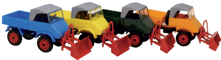
20401 Unimog 411 mit Räumschild, blau 20402 Unimog 411 mit Räumschild, gelb 20403 Unimog 411 mit Räumschild, grün 20404 Unimog 411 mit Räumschild, orange