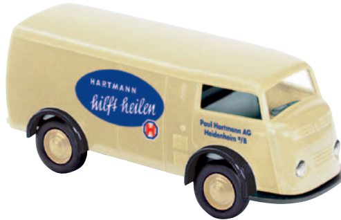
09141 Matador 1400 „Hartmann“ Verbandstoffe aus Heidenheim