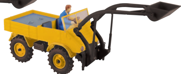
20434 Unimog mit Baaslader orange