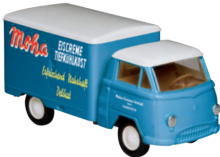
10609 Matador I „Moha“ Eis aus Frankfurt