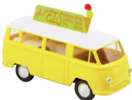
10221 Matador I „Eiswagen“ mit Dachschild und Isolierbehältern