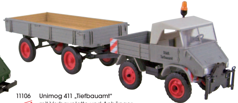
11106 Unimog 411 „Tiefbauamt“ mit Vorbauplatte und Anhänger