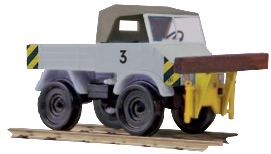
11050 Unimog 411 Zweigegefahzeug mit Wagondrückevorrichtung