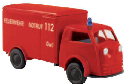
07511 Matador Feuerwehr Gerätewagen