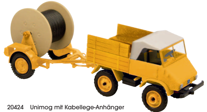
20424 Unimog mit Kabellege-Anhänger orange