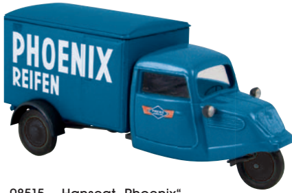
08515 Hanseat „Phoenix“ des Harburger Reifenwerkes