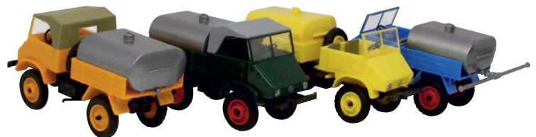
20414 Unimog 411 Sprengwagen, orange 20413 Unimog 411 Sprengwagen, grün 20412 Unimog 411 Sprengwagen, gelb 20411 Unimog 411 Sprengwagen, blau