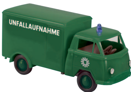
10516 Matador I Polizei für Unfallaufnahme