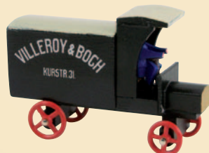
Nr. 14 Lieferwagen der Fa. Villeroy&Boch