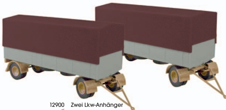
12900 Zwei Lkw-Anhänger