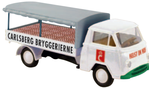
10338 Matador I „Carlsberg“ dänisches Bier