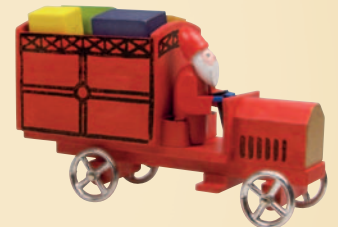
Nr. 9 Weihnachtsauto