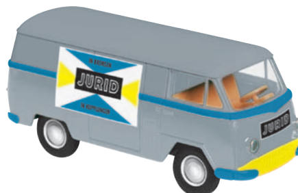
10151 Matador I „Jurid“ eines Ersatztegroßhändlers