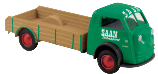
07410 Matador „SAAN“ holländisches Traditionsfahrzeug