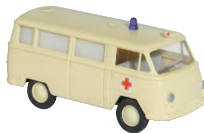
10204 Tempo Matador Krankenwagen DRK, Umbau der Firma Miesen, Bonn