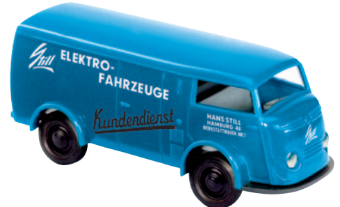
09138 Matador 1400 „Still“ Stapler und Karren aus Hamburg