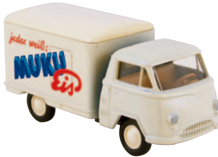
10604 Matador I „Muku Eis“ der badischen Regionalmarke