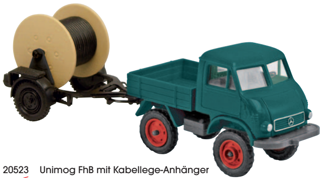
20523 Unimog FhB mit Kabellege-Anhänger grün NEU März 2012