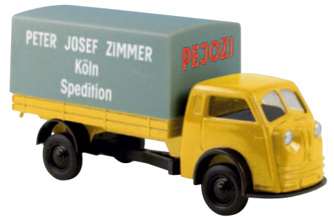
07307 Matador „PEJOZI“ der Spedition P.J.Zimmer, Köln