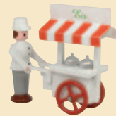
Nr. 8 Eismann