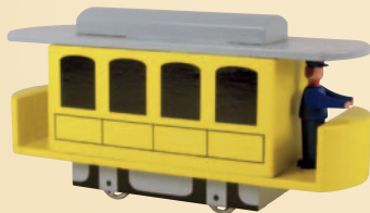
Nr. 13 Straßenbahn