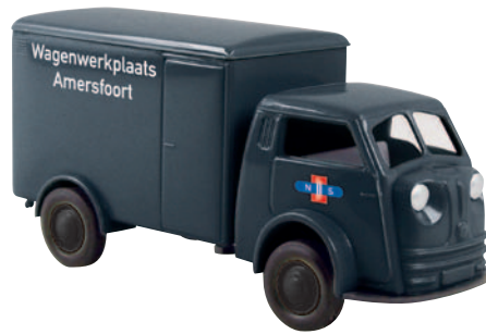
07509 Matador „NS Amersfoort“ aus dem Betriebswerk der NS