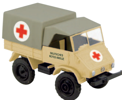
11027 Unimog 411 „DRK“ Hilfskonvoifahrzeug