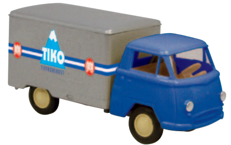
10607 Matador I „TIKO“ der Gemüseerzeuger eG