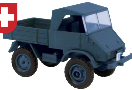
11049 Unimog 411 Schweizerarmee in schattenschwarz