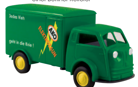
07507 Matador „AKO“ Allgäuer Elektrozaune