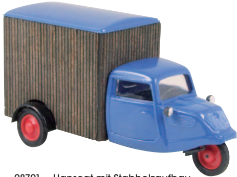
08701 Hanseat mit Stabholzaufbau in Lasercut-Technik