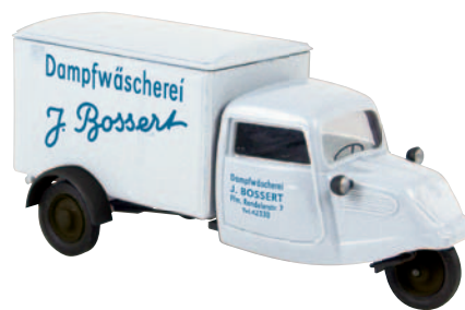
08512 Hanseat „Dampfwäscherei“ aus Frankfurt am Main