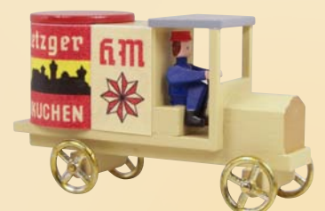
Nr. 23 Reklamewagen „Haeberlein-Metzger“