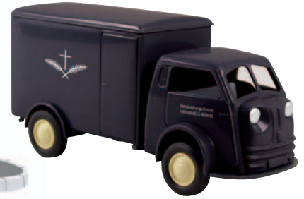
07506 Matador „Himmelheber“ Bestattungswagen