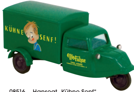
08516 Hanseat „Kühne Senf“ der Hamburger Delikatessenfabrik