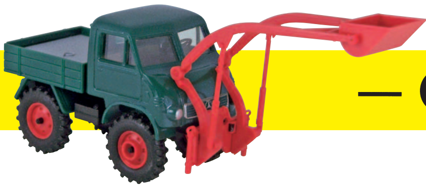
20533 Unimog FhB mit Baaslader grün