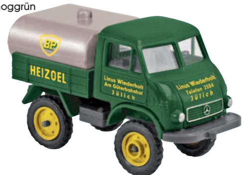
13006 Unimog FhB „Linus Wiederholt“ lief in Jülich