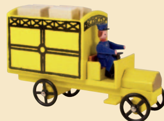
Nr. 15 Paketwagen der kaiserlichen Post