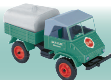
20418 Unimog 411 Sprengwagen „Sax & Klee“