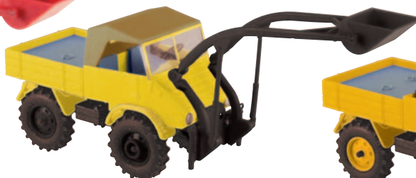
20432 Unimog mit Baas-Lader gelb