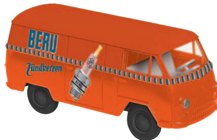
10163 Matador I „Beru“ damals mit rosa Isolatoren