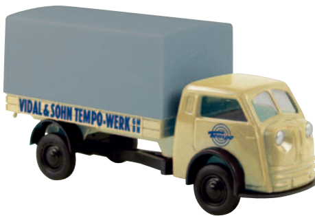
07306 Matador „Tempowerk“ aus dem Werksfuhrpark