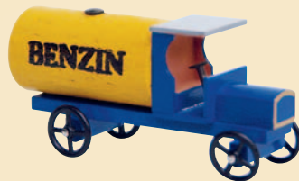
Nr. 6 Tankwagen