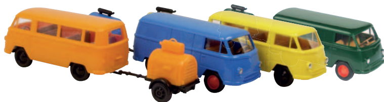
20514 Kombi mit Kompressor, orange 20511 Kastenwagen mit Kompressor, blau 20512 Kombi mit Kompressor, gelb 20513 Kastenwagen mit Kompressor, grün