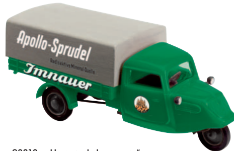
08318 Hanseat „Imnauer“ mit der Hohenzollernburg