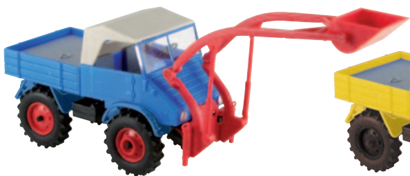
20431 Unimog mit Baas-Lader blau, mit Ladeschwinge Gr. 1