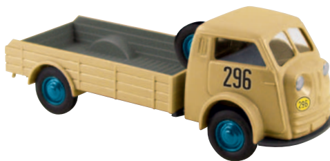
07402 Matador „Deutschlandfahrt“ das werbewirksame Langstreckenrennen