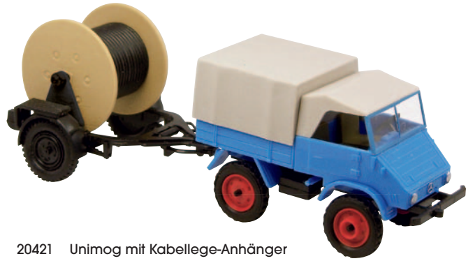
20421 Unimog mit Kabellege-Anhänger blau