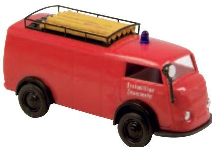
09122 Matador 1400 TSF mit Saugschläuchen