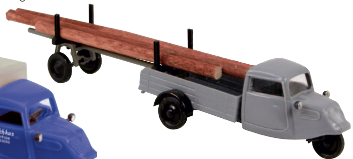
08411 Tempo Hanseat „Langholz“ mit typischem Nachläufer