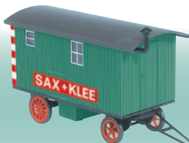
20218 Bauwagen „Sax & Klee“