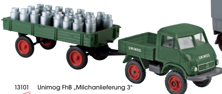
13101 Unimog FhB „Milchanlieferung 3“