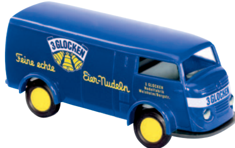
09137 Matador 1400 „3 Glocken“ Nudeln aus Weinheim