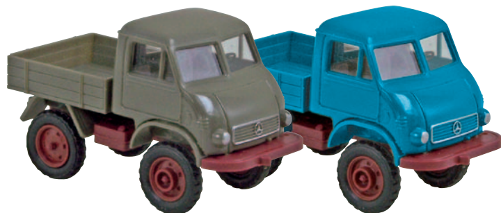
13000 Unimog 411 moosgrau mit Fahrerhaus B