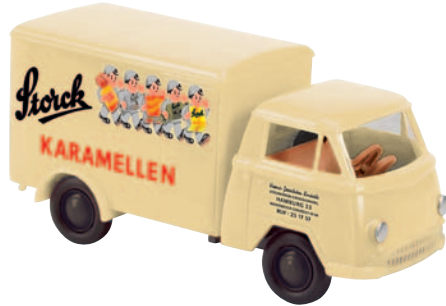
10513 Matador I „Storck“ Vertreterwagen