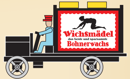
Nr. 26 Wichsmädel-Lieferwagen

Miniaturen aus Holz und Zinn wie anno dazumal. Nur für den erwachsenen Sammler! Kein Spielzeug im Sinne der Vorschriften der CE-EN71, insbesondere wegen der Verwendung traditioneller Materialien und verschluckbarer Kleinteile. Hergestellt zu 100% in Deutschland von der Epoche Modellbau GmbH.