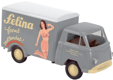
10515 Matador I „Felina“ Miederwaren aus Mannheim