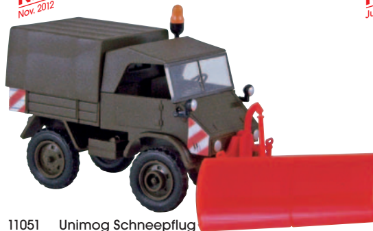
11051 Unimog Schneepflug einer Bw-Standortverwaltung