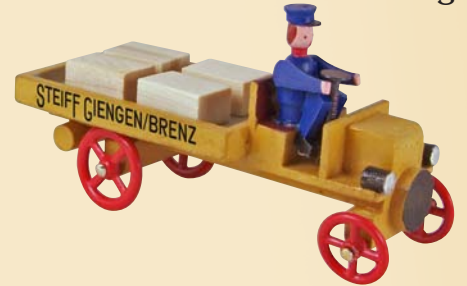
Nr. 27 Daimler-Lkw 1903