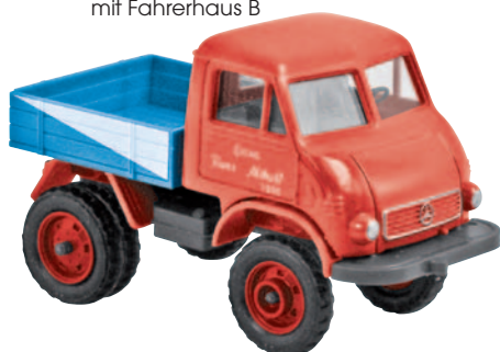
13004 Unimog FhB „Franz Althoff“ schleppte Wagen zum Festplatz