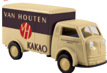
07504 Matador „van Houten“ der Kakao-Firma