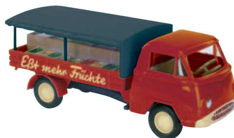
10329 Matador I „Eßt mehr Früchte“ für den Wochenmarkt