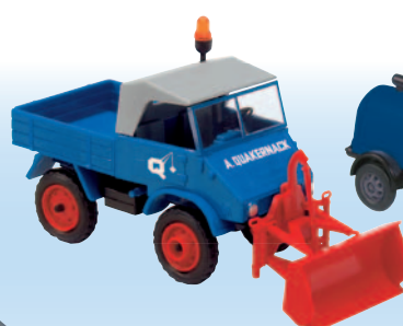
20406 Unimog 411 Erdschieber „August Quakernack“