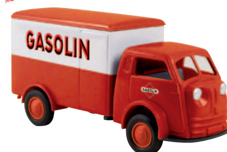
07505 Matador „Gasolin“ im Leuna-Stil