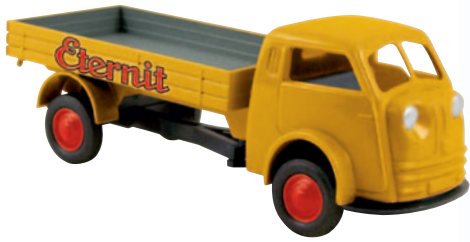
07309 Matador „Eternit“ heute als Hot Rod unterwegs