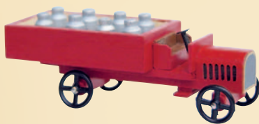
Nr. 2 Lastwagen mit Milchkanen