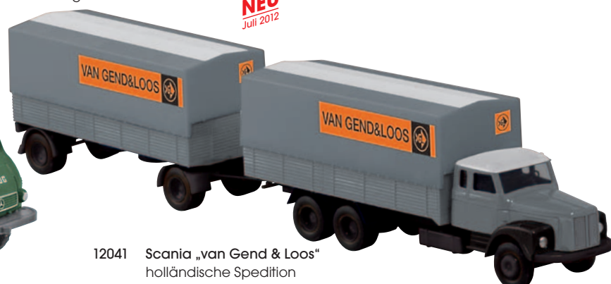
12041 Scania „van Gend & Loos“ holländische Spedition