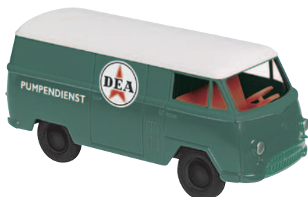
10165 Matador I „DEA“ prüft Zapfsäulen