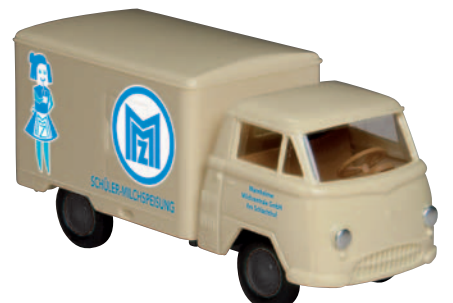
10611 Matador I „MMZ“ der Mannheimer Milchzentrale