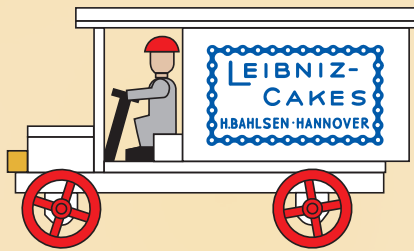
Nr. 24 Leibniz Cakes-Lieferwagen