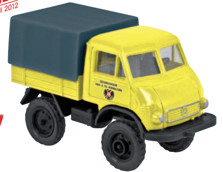
13008 Unimog FhB „Österr. Post“ im gelb-schwarzen Auftritt