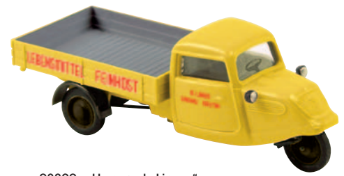
08320 Hanseat „Lingg“ aus Lindau am Bodensee