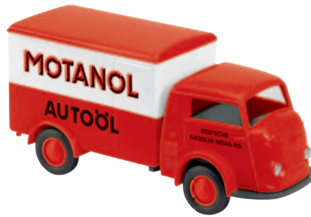
09503 Matador 1400 Koffer „Motanol“ mit der alten Leuna-Ölmarke