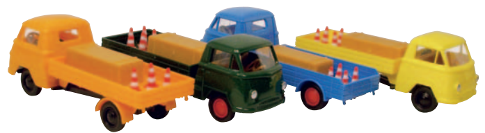
20614 Bau-Hochlader mit Zubehör, orange 20613 Bau-Hochlader mit Zubehör, grün 20611 Bau-Tiefflader mit Zubehör, blau 20612 Bau-Hochlader mit Zubehör, gelb