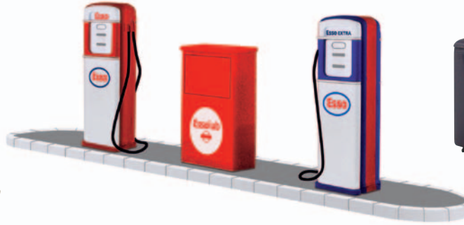
80101 Tankinsel Esso mit Gilbarco-Schwelm-Säulen für Esso und Esso Extra