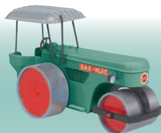
20118 Henschel Motorwalze „Sax & Klee“