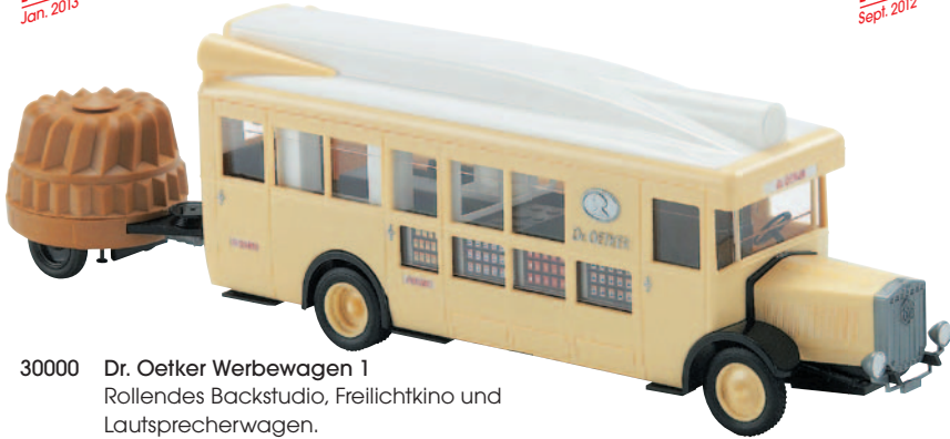
30000 Dr. Oetker Werbewagen 1 Rollendes Backstudio, Freilichtkino und Lautsprecherwagen.