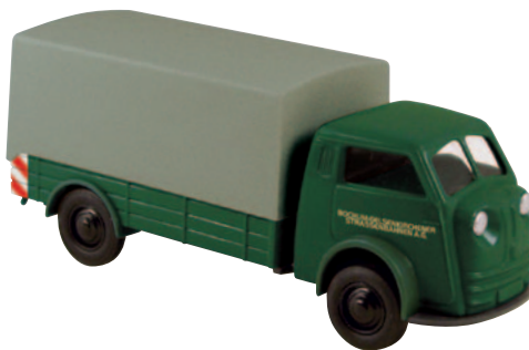
07409 Matador „Bogestra“ der Bochum-Gelsenkirchener Straßenbahn