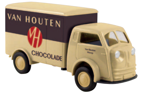
07510 Matador „van Houten“ holländische Ausführung