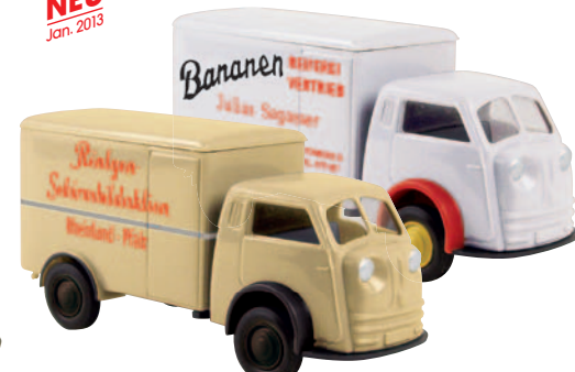
07501 Matador „Röntgenaktion“ aus Rheinland-Pfalz