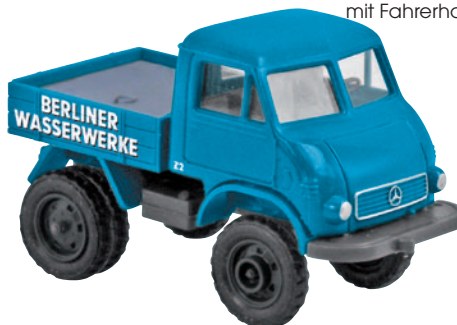
13005 Unimog FhB „Berliner Wasserwerke“ doppelbereifte Zugmaschine