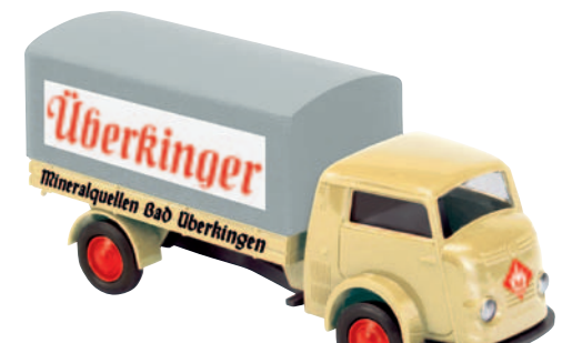
09313 Matador 1400 „Überkinger“ damals der meistgetrunkene Sprudel