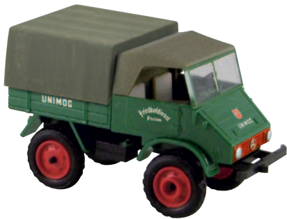
11045 Unimog 411 „Friedhofsdienst Paulsen“ läuft heute in Kiel