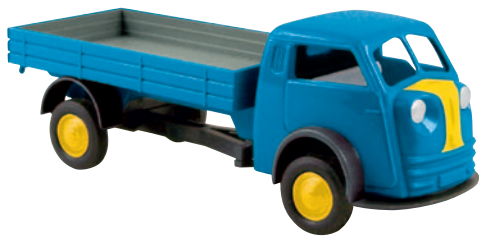
07303 Matador Traditionsfahrzeug im Daimler-Werk 40, Hamburg-Harburg