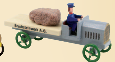
Nr. 16 Lastwagen mit Bruchstein