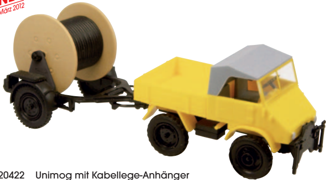
20422 Unimog mit Kabellege-Anhänger gelb