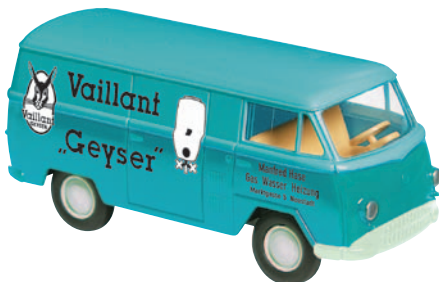
10160 Matador I „Installateur“ wirbt für Gasboiler aus Remscheid