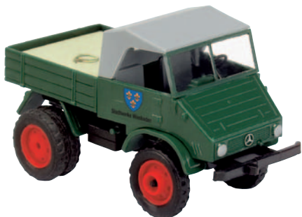
11018 Unimog 411 „Wiesbaden“ schleppte Trolleybusse