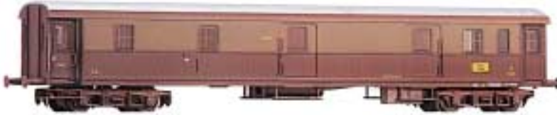
Postwagen FS-Typ 1934 Serie Uz 1300