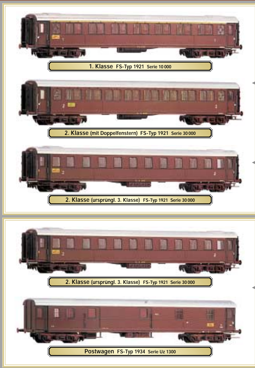
1. Klasse FS-Typ 1921 Serie 10 000

Die Vorbilder dieser typisch italienischen Wagen sind auch heute noch manchen Italienfreunden in Erinnerung. Diese Wagen liefen bis Ende der 60er Jahre weit über die Grenzen Italiens hinaus und gelangten im internationalen Fernverkehr sogar bis Berlin und Hamburg. Die braune Farbgebung war wohl weniger als Reminiszenz an vergangene unselige Zeiten mit dieser politischen Färbung gedacht, sondern eher nur die Simplifizierung der vorhergehenden zweifarbigen »Castano-Isabella«-Farbgebung, bei gleichzeitiger optischer Schmutzbeständigkeit (Rost, Ruß), im nicht nur wasserarmen Italien damals von Wichtigkeit: 1950 waren in Italien trotz fortschreitender Elektrifizierung noch fast 4000 Dampfloks in Betrieb, 1960 immerhin noch über 1500! In Kombination mit den nach wie vor in »Castano-Isabella« lackierten Loks gaben sie zumindest im neu-lackierten Zustand ein erfreulicheres Bild als die bei den benachbarten Bahnen zu dieser Zeit meist üblichen schwarzgrünen Personenwagen. Zudem waren gleichzeitig auch noch Wagen mit altem 2-farbigem Anstrich in Betrieb.