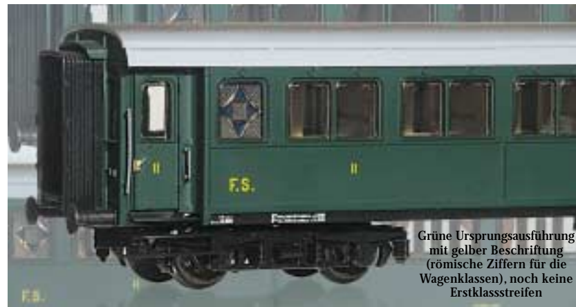
Grüne Ursprungsausführung mit gelber Beschriftung (römische Ziffern für die Wagenklassen), noch keine Erstklassstreifen