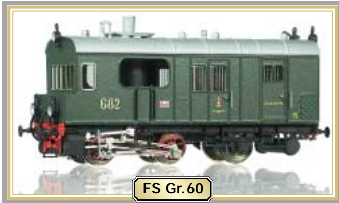
FS Gr. 60