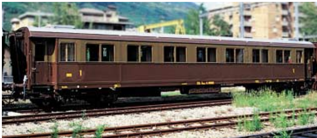
▲ Mindestens einer dieser Schnellzugwagen ist noch erhalten und wird regelmäßig für historische Sonderzüge („treni storici“, z.B. auf der FS-Veltlin-Bahn) eingesetzt.

»Typ 1921« Baujahr 1927–1935 Bis Ende der 1980er-Jahre im Einsatz