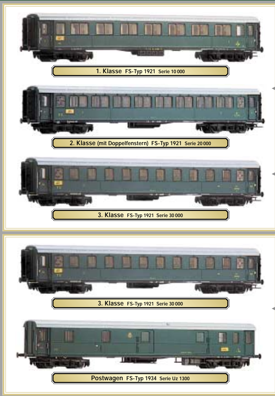
1. Klasse FS-Typ 1921 Serie 10 000