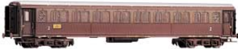
2. Klasse (mit Doppelfenster) FS-Typ 1921 Serie 20 000