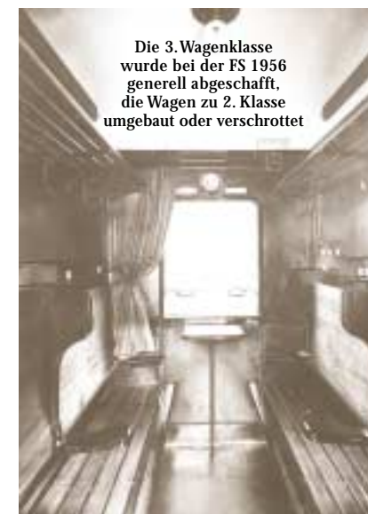
Die 3. Wagenklasse wurde bei der FS 1956 generell abgeschafft, die Wagen zu 2. Klasse umgebaut oder verschrottet

Für detaillierte Informationen zur Technik, Geschichte und Entwicklung der italienischen Personenwagen siehe z.B. folgende Bücher: