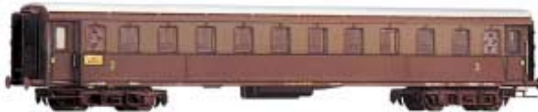
3. Klasse FS-Typ 1921 Serie 30 000