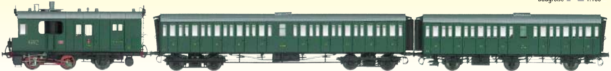
Dampftriebwagen mit Gepäck- und Postabteil FS Reihe 60 (dunkelgrün)