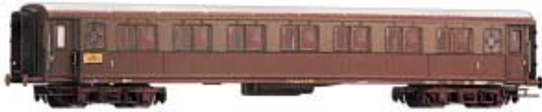
1. Klasse FS-Typ 1921 Serie 10 000