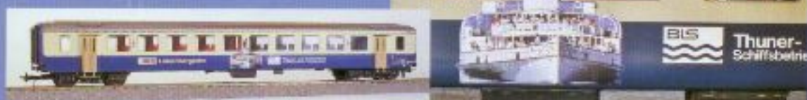
Nr. 452-, Nr. 453= Thunersee Ew 1, B, 2. Klasse, BLS Voiture unifiée 1, B, 2ème classe, BLS