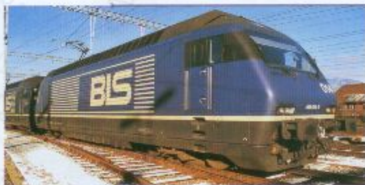
Nr. 184–, Nr. 185= Spalenberg Re 465 014-9 BLS