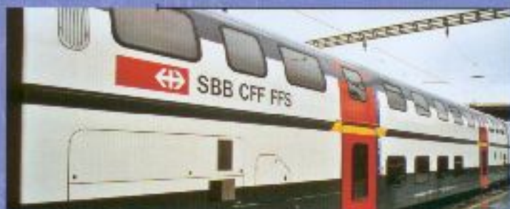
Nr. 700-, Nr. 701= IC 2000, A, 1. Klasse, SBB CFF FFS Voiture IC 2000, A, 1ère classe, SBB CFF FFS