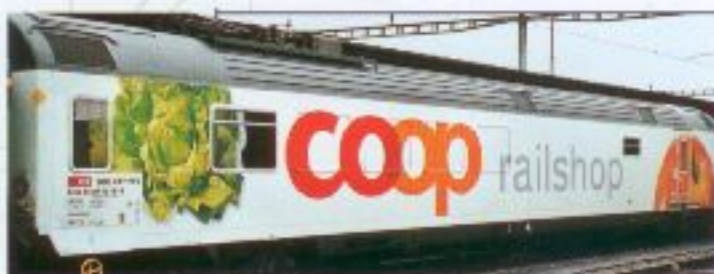
Nr. 710-, Nr. 711= Coop Coop Railshop Wagen Voiture Railshop Coop