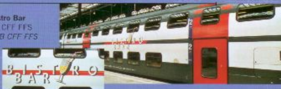
Nr. 706-, Nr. 707= Bistro Bar IC 2000 Barwagen, SBB CFF FFS Voiture-Bar IC 2000, SBB CFF FFS