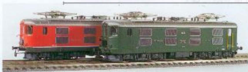
Nr. 237~, Nr. 238= Re 4/4' Pendellok rot Re 4/4' navette rouge