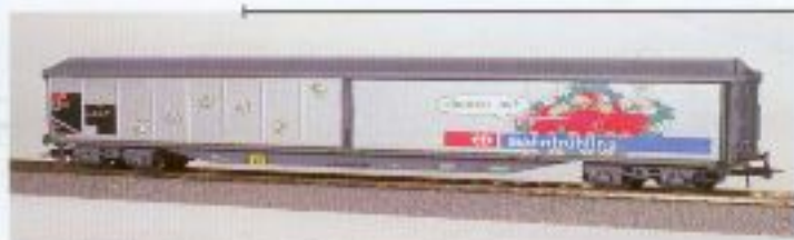
Nr. 602-, Nr. 603= Bahnfrühling Geschlossener, 4-achsiger Güterwagen Typ Habils, SBB CFF FFS Wagon marchandise couvert 4 essieux, type habils, SBB CFF FFS