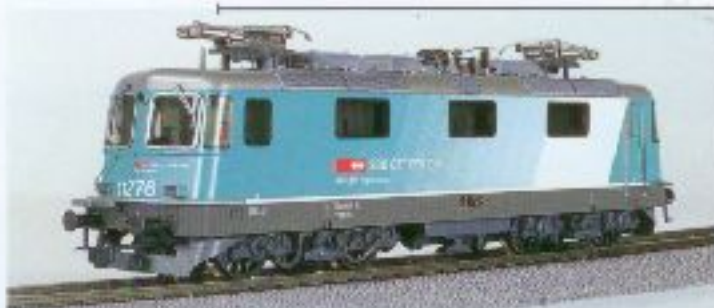
Nr. 246–, Nr. 247= Cargo Re 4/4 + Güterzuglokom SBB CFF FFS Locomotive train marchandise SBB CFF FFS