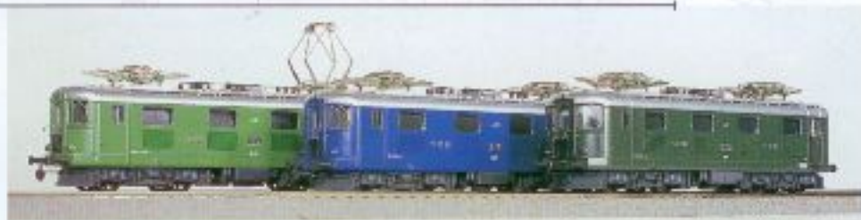
Nr. 235~, Nr. 236= Re 4/4' Pendellok Serie 1 lindengrün Re 4/4' navette série 1 verte tilleul