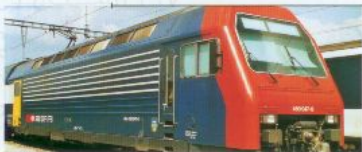
Nr. 284~, Nr. 285= Re 450 S-Bahn-Lok Locomotive du RER