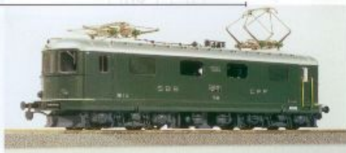
Nr. 220–, Nr. 221= Re 4/4 + grün/verte