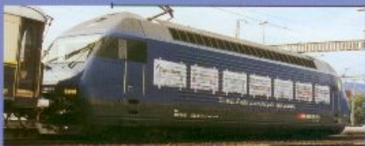
Nr. 280-, Nr. 281= Swisspool Re 460 019-3 SBB CFF FFS