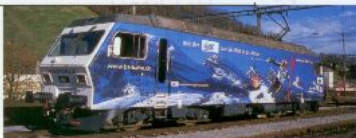
Nr. 186-, Nr. 187= Ski WM Ski WM St. Anton 2001 CM de ski St. Anton 2001 Re 456 093-4 BT