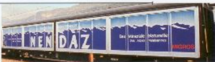
Nr. 384-, Nr. 385= Nendaz Geschlossener, 4-achsiger Güterwagen Typ Habils, SBB CFF FFS Wagon marchandise couvert 4 essieux, type habils, SBB CFF FFS