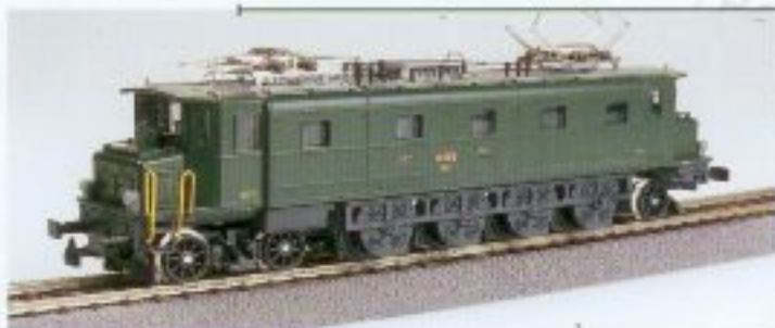
Nr. 138-, Nr. 139= Ae 4/7 Neue Generation Nouvelle génération