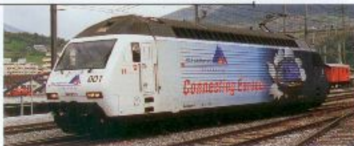
Nr. 184-, Nr. 185= Alptransit Connecting Europa Re 465 001-6 BLS