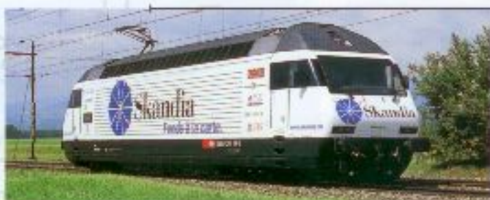
Nr. 280-, Nr. 281= Skandia Skandia Leben Re 460 038-3 SBB CFF FFS