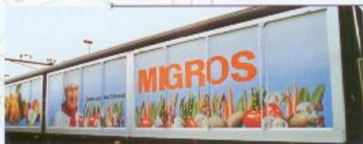
Nr. 384-, Nr. 385= Migros Geschlossener, 4-achsiger Güterwagen Typ Habils, SBB CFF FFS Wagon marchandise couvert 4 essieux, type habils, SBB CFF FFS