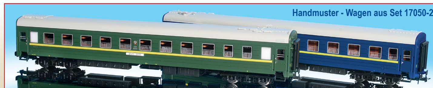
Handmuster - Wagen aus Set 17050-2

Viele Freunde Russischer Wagen haben Heris gebeten, für die Soldatenzüge in der DDR den Wagentyp 909 Ad, in Polen gebaut, zu realisieren. Dieser Wagen wird nun unter der Artikelnummer 17058 angeboten. Parallel wird unter der Artikelnummer 17065 ein in Russland gebauter Platzkart-Wagen angeboten werden, der dem Typ Kalinin PN entspricht. So entsteht noch mehr Abwechslung in dem Angebot von Breitspurwagen bei HERIS.