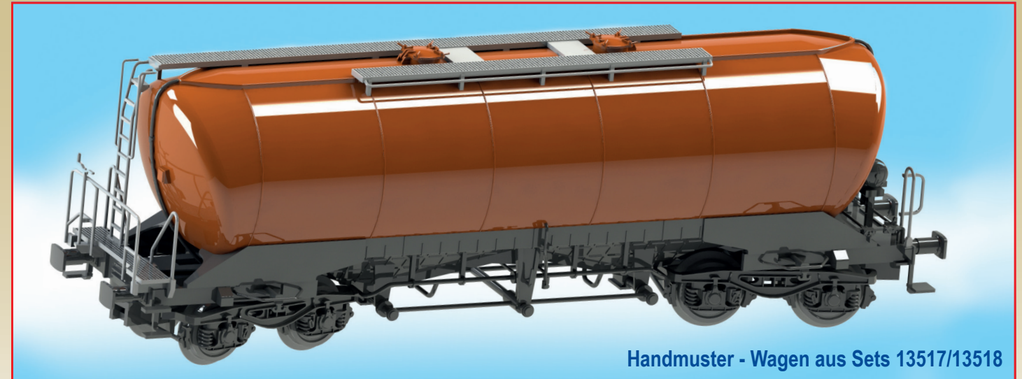
Handmuster - Wagen aus Sets 13517/13518