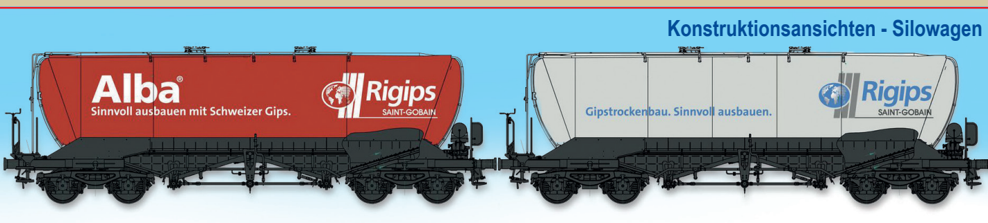
Konstruktionsansichten - Silowagen