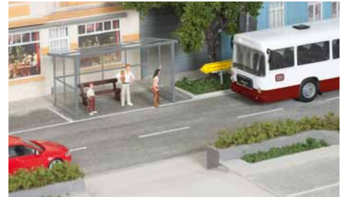
053471 Parkbank als Zubehör erhältlich. Link zum Produkt: www.herpa.de?053471 053471 Park bench available as an accessory. Link to product: www.herpa.de?053471