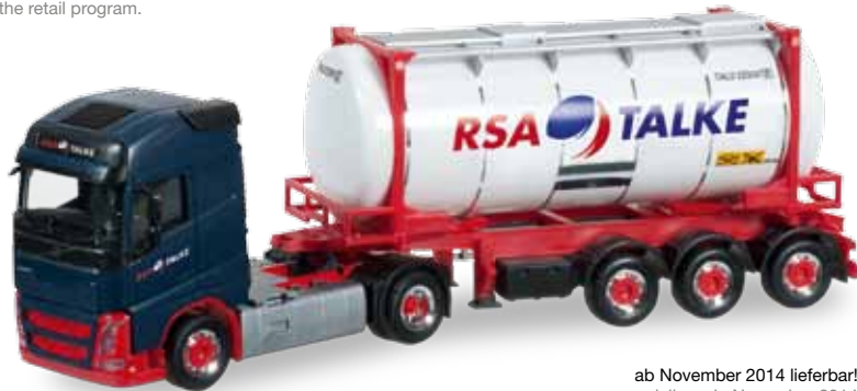
ab November 2014 lieferbar! delivery in November 2014 HO 1/87

MAN TGX XXL 640 Euro 6 Schwerlast-Zugmaschine / MAN TGX XXL 640 Euro 6 heavy load tractor MAN TGX XXL 560 Euro 6 Schwerlast-Zugmaschine / MAN TGX XXL 560 Euro 6 heavy load tractor Formneuheit! Auf der IAA 2014 in Hannover wurde die neue MAN TGX Euro 6 Schwerlast-Zugmaschine mit 560 oder 640 PS erstmalig präsentiert. Herpa realisiert die entsprechenden Modelle zeitnah mit neuen Schwerlasttürmen sowie geänderten Fahrgestellen und neuer Fahrzeugfront für das Handelsprogramm. / New type! At the IAA 2014 in Hannover the new MAN TGX Euro 6 heavy load rigid tractor with 560 or 640 HP was premiered. Herpa realized the respective models promptly with new heavy-duty towers and modified chassis and new vehicle front for the retail program.