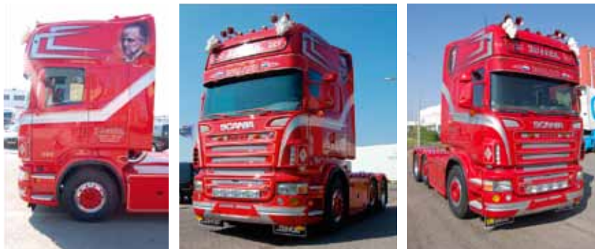
052825 Fanfaren und 743297 Michelin Figur zum Nachrüsten als Zubehör erhältlich. Link zum Produkt: www.herpa.de?052825 und www.herpa.de?743297 / 052825 Horns and 743297 Michelin figurines are available as accessories. Link to product: www.herpa.de?052825 and www.herpa.de?743297