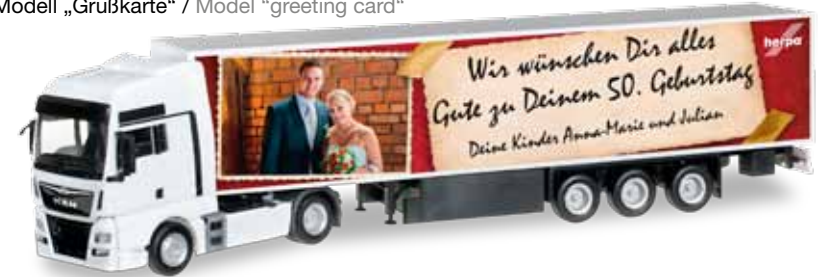
Modell „Grußkarte“ / Model "greeting card"

Bildgröße auf beiden Modellen ca. 3,5 x 2,5 cm. Individuelle Anpassungen des Fotos (Größe, Beschnitt) vorbehalten. Pro Modell eine Bestellung. / Image size on both models ca. 3.5 x 2.5 cm. Subject to individual modifications (size, trimming). One order per model.