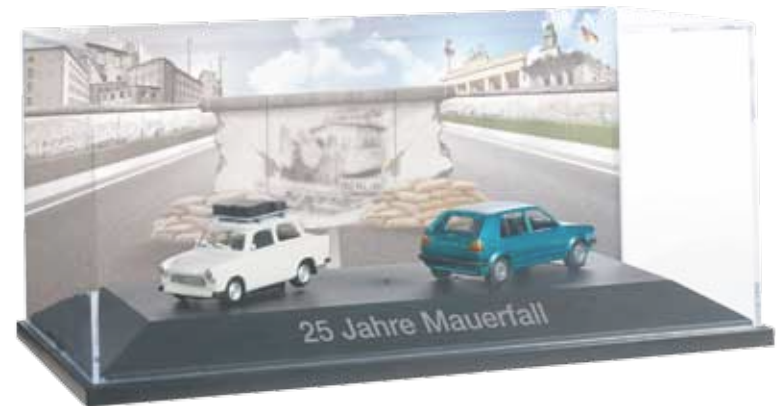
ab November 2014 lieferbar! delivery in November 2014 HO 1/87

101943 29,50 € Set mit Trabant, cremeweiß mit Dachträger und VW Golf, blaumetallic / Set with Trabant, creme white with roof rack and VW Golf, blue metallic „25 Jahre Mauerfall“