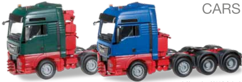
ab November 2014 lieferbar! delivery in November 2014 HO 1/87