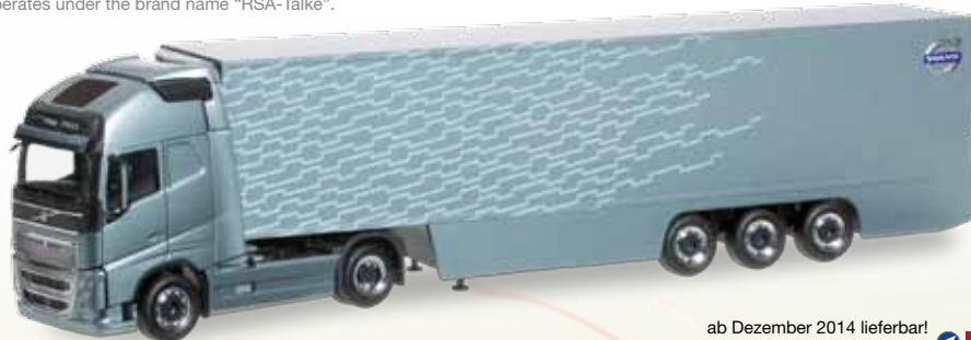
ab Dezember 2014 lieferbar! delivery in December 2014 HO 1/87

917834 32,50 € Volvo FH GI. Swapcontainer-Sattelzug / Volvo FH GI. swapcontainer semitrailer „RSA Talke“ Die bekannte Spedition Talke aus Hürth bei Köln betreibt ein Joint Venture in Saudi Arabien, wo der Logistiker unter der Marke "RSA-Talke" unterwegs ist. / The well-known forwarder Talke from Hürth near Cologne operates a joint-venture in Saudi Arabia where the logistics specialist operates under the brand name "RSA-Talke".