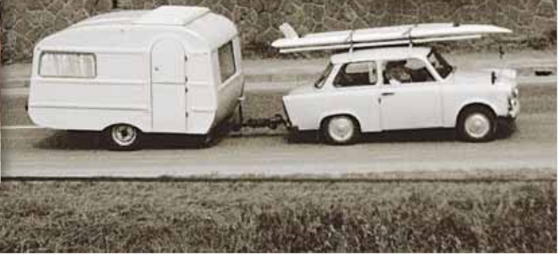
Mit der ganzen Familie an den Balaton. Bis zu 20 Stunden Anreise mit 70 km/h nahmen Millionen DDR-Bürger dafür in Kauf. With the entire family to the Balaton. Millions of GDR residents put up with up to 20 hours of travelling time at 70 km/h.

Trabi-Tür“ war ein übliches Angebot. Durch die einfache und unkomplizierte Bauweise aller Fahrzeuge konnte man Reparaturen oder Umbauten meist selbst durchführen. Vielleicht sind es diese Geschichten, die die Faszination rund um die Fahrzeuge aus dem Osten immer wieder neu entfachen. Barkas, Trabant, Framo, GAZ, IFA 60 und Co sind heute als Oldtimer begehrt und kaum günstiger als ihre westlichen Partner. Wer wie viele seiner Landsleute damals nach Öffnung der Grenzen seinen Trabant, Wartburg oder andere Fahrzeuge im Westen gegen einen Golf eingetauscht hatte, ärgert sich vielleicht heute noch manchmal, dass er dieses „Kulturgut“ nicht in seiner Garage zum Oldtimer reifen ließ.