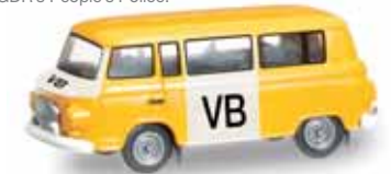
066358 16,50 € Barkas B 1000 Bus „VB, Polizei Tschechien“ (CZ) Zu Zeiten des Eisernen Vorhangs wurde bei der Polizei in der Tschechoslowakei Barkas B 1000 Busse bei der Verkehrspolizei eingesetzt. / During the times of the Iron Curtain the traffic police in Czechoslovakia operated Barkas B 1000 busses.