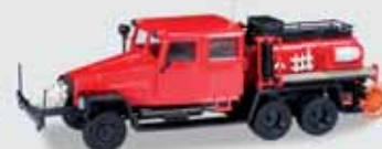
049900 39,50 € IFA G5 Tanklöschfahrzeug / Tank firefigting vehicle „Feuerwehr“