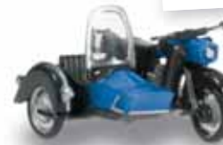
ab Januar 2014 lieferbar! delivery in January 2014 H0 1/87 053433-002 16,50 € MZ 250 Gespann / MZ 250 Set Farbneuhheit: blau/schwarz / New colour: blue/black