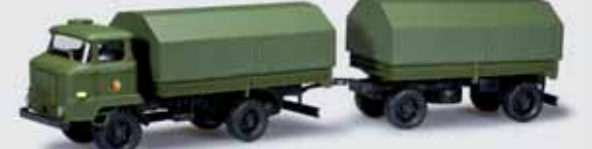
744584 29,90 € IFA L 60 Planen-Hängerzug / canvas cover trailer „NVA“