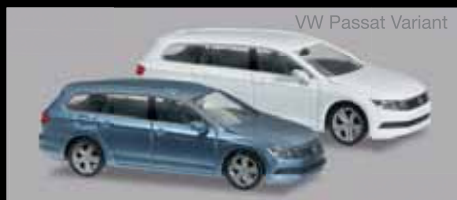
VW Passat Variant