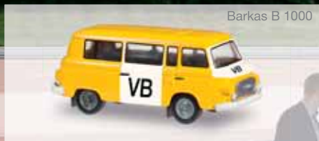
Barkas B 1000