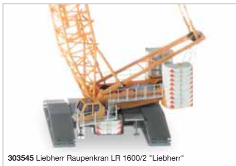
303545 Liebherr Raupenkran LR 1600/2 "Liebherr"

Weitere Kranmodelle bei uns erhältlich! We have additional crane models available!