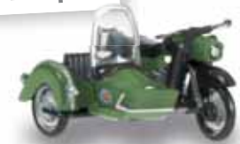
091787 17,50 € MZ 250 mit Beiwagen / MZ 250 with matching sidecar „Volkspolizei“ In der für die DDR-Volkspolizei typischen Farbgebung erscheint das Zweiradgespann mit entsprechendem Logo. / The motorcycle combination with the respective logo is release in the typical colors of the GDR's People's Police.