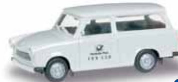
091831 14,50 € Trabant 601 Universal „Deutsche Post / DDR“ Seit nunmehr 25 Jahren sind diese Klassiker nicht mehr im Dienst. In der ehemaligen DDR wurden diese Trabant bei der Deutschen Post eingesetzt. / In the former GDR this Trabant was operated by the Deutsche Post. The operation was discontinued 25 years ago.