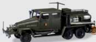
744157 39,50 € IFA G5 TLF „NVA“