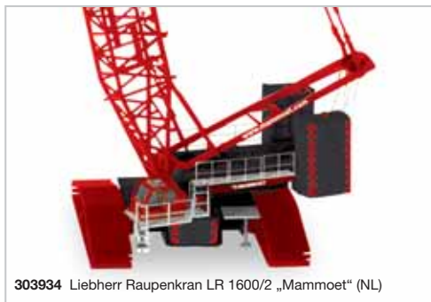
303934 Liebherr Raupenkran LR 1600/2 „Mammoet“ (NL)