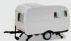
053099 10,00 € Qek Junior Wohnwagen / caravan