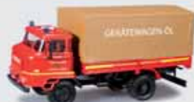
091046 19,90 € IFA L 60 Planen-LKW Gerätewagen-Öl canvas truck „Feuerwehr Neustadt/Coburg“