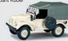
027595 11,50 € GAZ 69