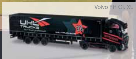
Volvo FH Gl. XL