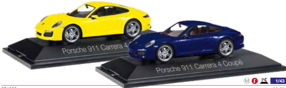
071086 39,50 € 071093 39,50 € Porsche 911 Carrera 4 Coupé, racing gelb / racing yellow Porsche 911 Carrera 4 Coupé, dunkelblau metallic / dark blue metallic

New type! The first car body variants of the new Porsche 911 Carrera in the 1/43 scale are especially detailed. Next to the replicated board instruments the models also feature details like colored break shoes and the striking Porsche logo on the hood. All model variants displayed here will be delivered in high-quality show-cases.