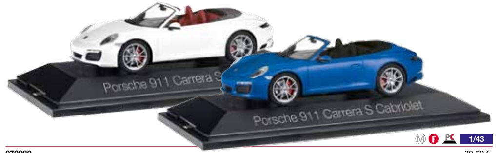
070980 39,50 € 070997 39,50 € Porsche 911 Carrera S Cabriolet 991 II, weiß / white Porsche 911 Carrera S Cabriolet 991 II, saphirblau metallic / saphir blue metallic