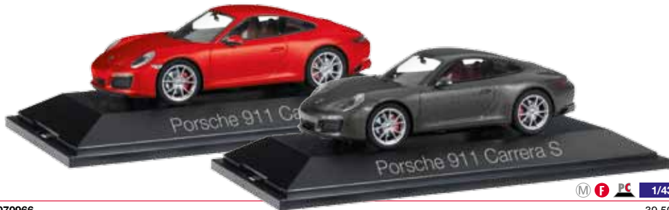
070966 39,50 € 070973 39,50 € Porsche 911 Carrera S Coupé 991 II, indischrot / indisch red Porsche 911 Carrera Coupé 991 II, achatgrau metallic / achatgrey metallic