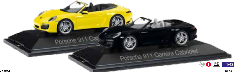
071024 39,50 € 071031 39,50 € Porsche 911 Carrera Cabriolet 991 II, racing gelb / racing yellow Porsche 911 Carrera Cabriolet 991 II, tiefschwarz metallic / deep black metallic

New type! The first car body variants of the new Porsche 911 Carrera in the 1/43 scale are especially detailed. Next to the replicated board instruments the models also feature details like colored break shoes and the striking Porsche logo on the hood. All model variants displayed here will be delivered in high-quality show-cases.