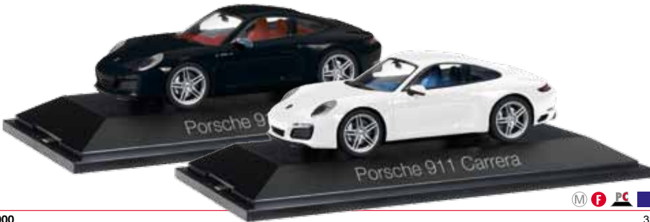
071000 39,50 € 071017 39,50 € Porsche 911 Carrera Coupé 991 II, schwarz / black Porsche 911 Carrera Coupé 991 II, carraraweiß metallic / carrara white metallic

Formneuheit! Besonders detailliert sind die ersten Karosserievarianten des neuen Porsche 911 Carrera – im Maßstab 1:43. Die Modelle begeistern mit nachgebildeten Bordinstrumenten und Details wie farbigen Bremsbacken sowie dem markanten Porsche-Logo auf der Motorhaube. Alle hier gezeigten Modellvarianten werden in einer hochwertigen Vitrine an den Handel ausgeliefert.