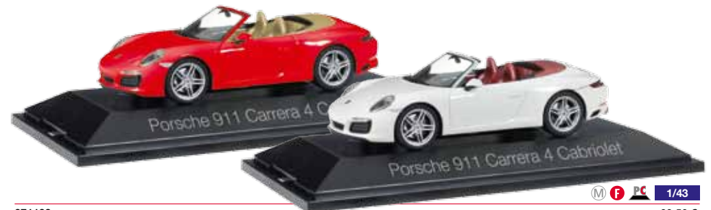
071109 39,50 € 071116 39,50 € Porsche 911 Carrera 4 Cabriolet, indischrot / indisch red Porsche 911 Carrera 4 Cabriolet, carraraweiß metallic / carrara white metallic