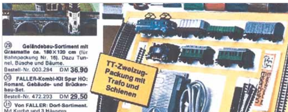
Modellbahn mit Fahrzeugen, Schienenoval und Fahrpult für 12,90 DM. TT-Modelle aus dem Quelle-Katalog der 60er Jahre Model railway with vehicles, a set of tracks and throttle for 12.90 German Marks. TT-models from the Quelle catalogue from the 1960s.

Ursprünglich in den USA erstmals von Harald L. Joyce im Jahr 1941 vorgestellt, war die Baugröße TT die Rettung für die Modellbahn in der DDR. Durch den allgegenwärtigen Material- und Platzmangel entwickelte Zeuke & Wegwerth die ersten Modellbahnen im Maßstab 1:120. Die erste Lok war eine BR23, die 1957 auf der Frühjahrsmesse in Leipzig vorgestellt wurde. Die zahlreichen Details in TT wurden in dieser Form selbst bei den H0 Herstellern erst ab den 70er Jahren nachgebildet. Um den Maßstab auch in der BRD erfolgreich zu machen, wurde viel Geld investiert. Die TT-