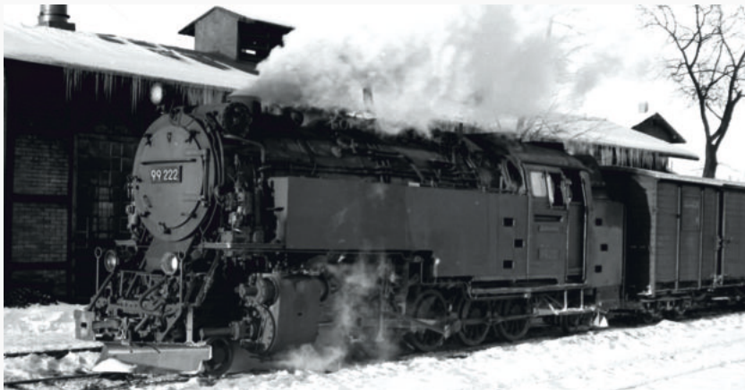
99 222 - Zustand 1968