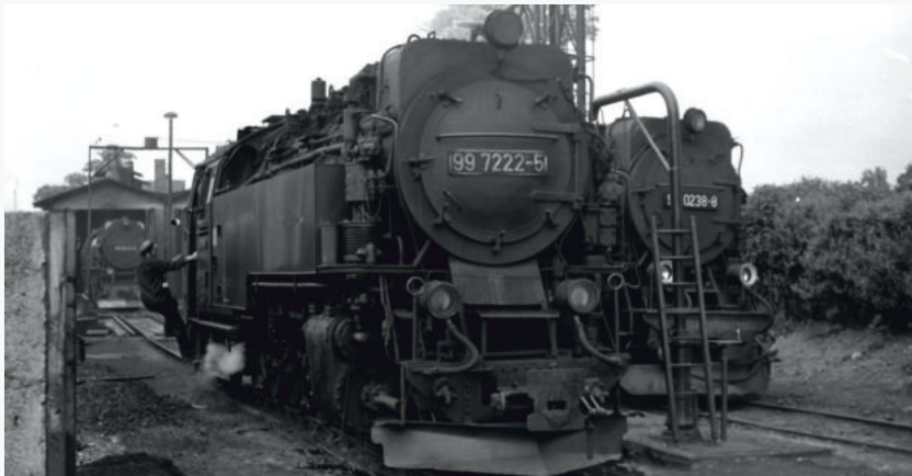
99 7222-5 - Zustand 1981