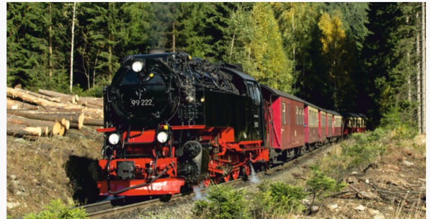
99 222 - Zustand 2012