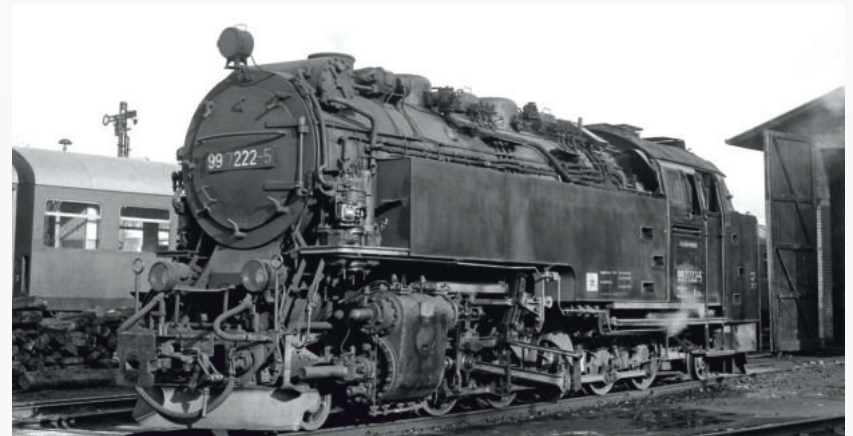
99 7222-5 - Zustand 1972