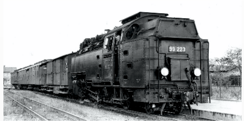
99 223 - Zustand 1933