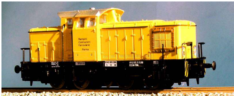
ART.1350 LOCODIESEL (ex V60 DB) Impresa Rampini e/o Valsecchi Epoca IV - V