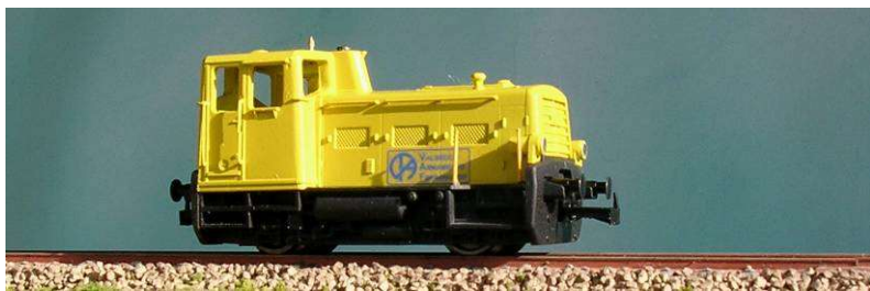
ART.1330. LOCODIESEL (ex 218 FS) nella livrea dell'Impresa Valsecchi Epoca IV - V