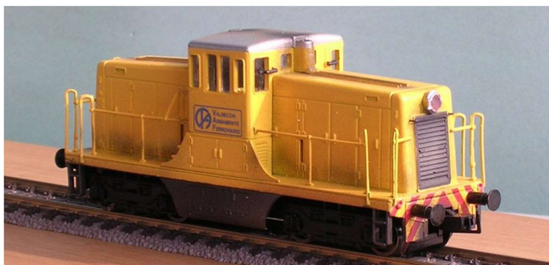
ART.1335 LOCODIESEL (ex GE) Impresa Valsecchi Epoca IV - V