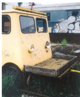
ART.1410: Draisina FS Con piano di carico posteriore Epoca III/IV