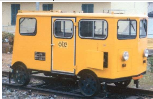
ART.1400: Draisina FS OTE Epoca III/IV