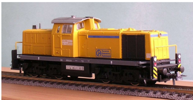
ART.1345 LOCODIESEL (ex V290 DB) Impresa Valsecchi Epoca IV - V