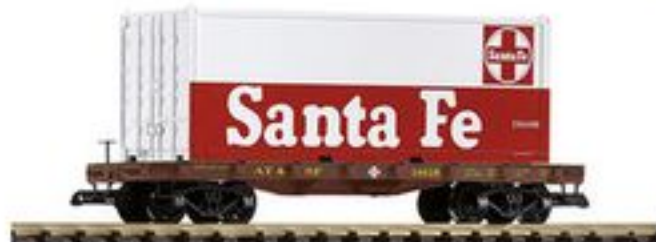
38732 Containerertragwagen SF