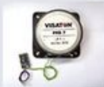
36226 Sound-Modul mit wetter- beständigem Lautsprecher 134,99 €*

Mit dem Gartenbahn Modell der BR 132 erfüllt PIKO den Wunsch zahlreicher Kerne und Liebhaber dieser eindrucksvollen Großdiesellok, die längst Kultstatus genießt.