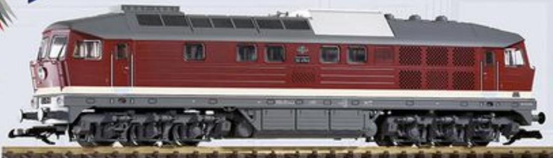
37580 Diesellokomotive BR 132 DR Ep. IV