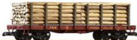
38720 Runnenwagen PRR mit Holzladung