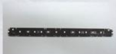
56292 LED-Beleuchtungsbausatz x-Steuerwagen