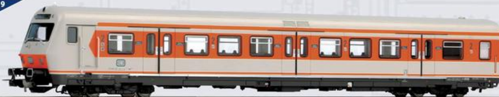
58501 Personenwagen x-Steuerwagen 2. Klasse DB Ep. IV