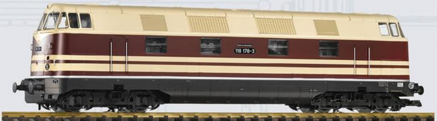
37575 Diesellok BR 118 DR Ep. IV, vierachsig