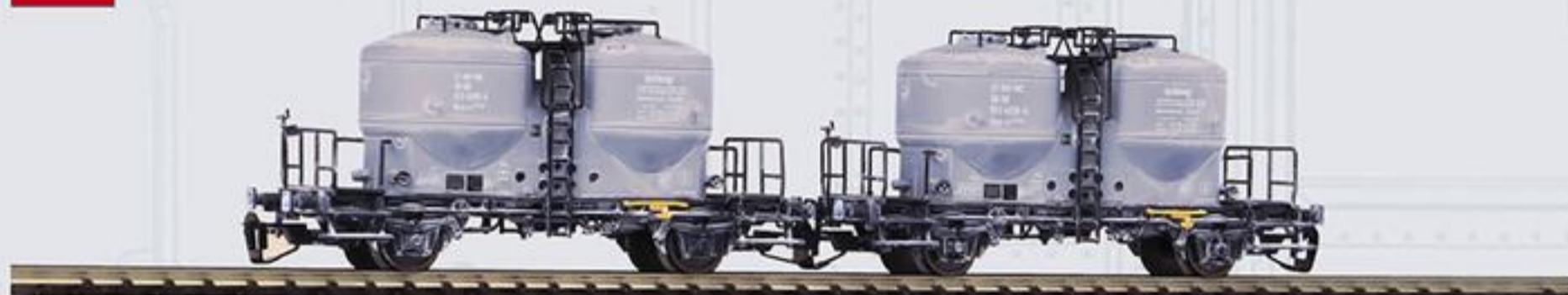
47030 Zementsilowagen DR Ep. IV, 2-er Set, gealtert