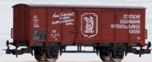
58910 Gedeckter Güterwagen G02 24,99 €* „DEVK“ DB Ep. III; # 56060