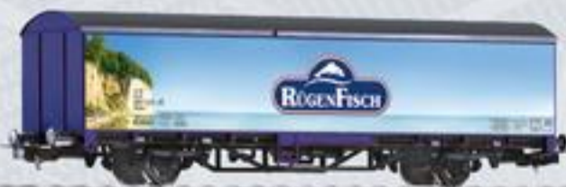
58766 Gedeckter Güterwagen „Rügenfisch“ 24,99 €* DB AG Ep. VI; # 56060