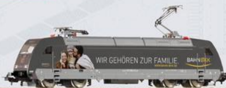
59458 E-Lok BR 101 BKK DB AG Ep. VI 99,99 €* 59258 E-Lok BR 101 BKK DB AG Ep. VI 139,99 €*