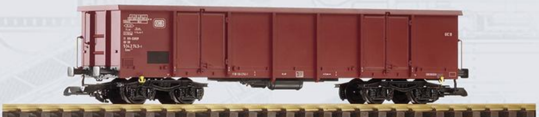
37743 Offener Drehgestellwagen Eaos DB Ep. IV

Ein vorbildgerechter DR-Schnellzug mit der PIKO BR 118 kann authentisch mit den vierachsigen PIKO Reichsbahn-Rekowagen 37650-37652 nachgebildet werden. Wer einen eindrucksvollen Ganzzug als Güterzug bevorzugt, kann auf die PIKO Zementsilowagen 37792 zurückgreifen.