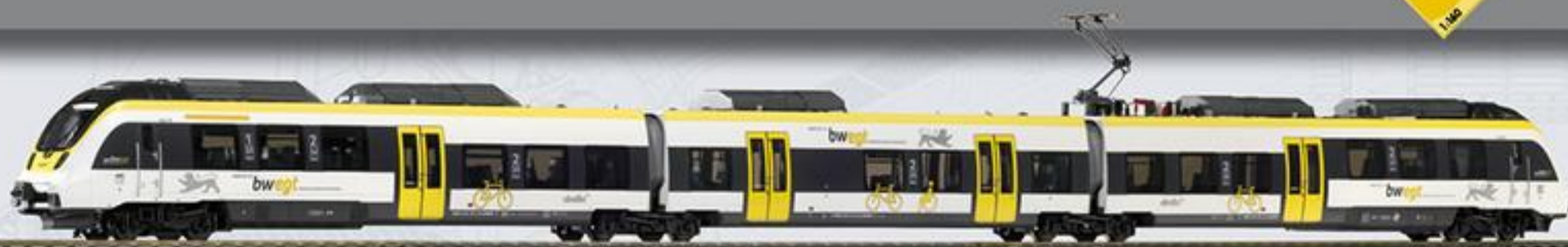
40207 3-tlg. Elektrotriebwagen BR 442 „Talent 2 - Baden-Württemberg Design“ Abellio Ep. VI