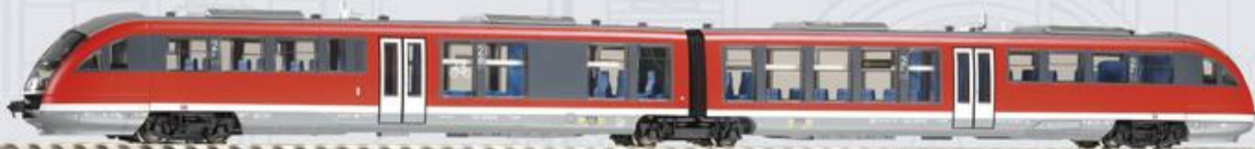
52089 Dieseltriebwagen Desiro BR 642 DB AG Ep. V, neutral 229,99 €* 52289 Dieseltriebwagen Desiro BR 642 DB AG Ep. V, neutral 249,99 €*