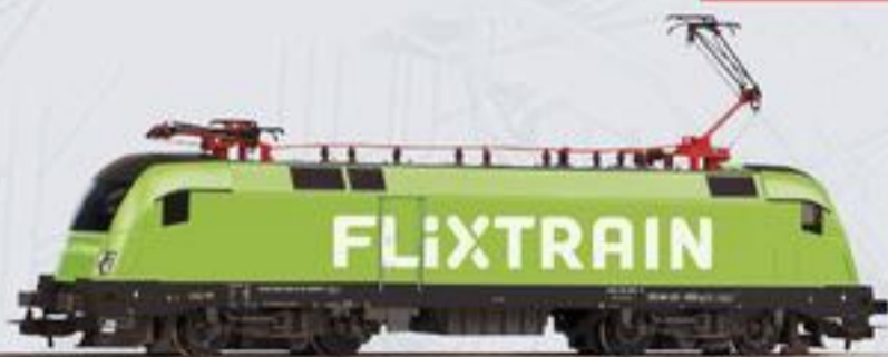
57924 E-Lok Taurus „Flixtrain“ Ep. VI 59,99 €* 57824 E-Lok Taurus „Flixtrain“ Ep. VI 99,99 €*